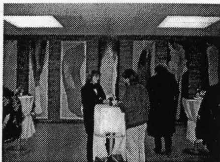
Zehn Jahre Gegenwartskunst und Kirche Gespräche im Foyer des Hospitalhofs

Spiritualität, weltliche Kultur und kirchliche Frömmigkeit sollten zueinander finden. Die Bildung der natürlichen Vernunft und die Kulturarbeit der Menschen sollten gefördert werden, aber sich nicht in geistigem und geistlichem Hochmut, sondern in der Erkenntnis Gottes als des Schöpfers und Versöhhners vollenden. Das macht Melanchthon und seinen Protestantismus uns Heutigen nah.