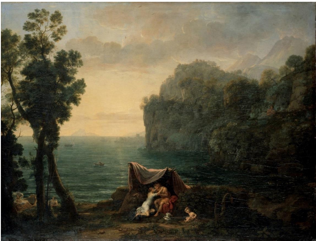
Claude Lorrain: Acis und Galateia [1657]

Karamazovy (1881-1882) sei weder das Gemälde noch der Begriff zu finden, doch das Motiv des goldenen Zeitalters sei schließlich in den Träumen Mitjas und Aljošas vorhanden (vgl. ebd., 179) sowie in der Legende des Großinquisitors (vgl. ebd., 179). Dostoevskij hatte Lorrains Gemälde Acis und Galateia während seiner ersten Europareise 1862 in der Galerie der alten Meister in Dresden mehrmals gesehen. Das Gemälde zeigt eine Szene aus dem 13. Buch von Ovids Metamorphosen , in der der Zyklop Polyphem die beiden Geliebten Akis und Galateia von einem Felsen aus beobachtet (im rechten mittleren Bildabschnitt, kaum zu erkennen), kurz bevor er Akis aus Eifersucht erschlägt: