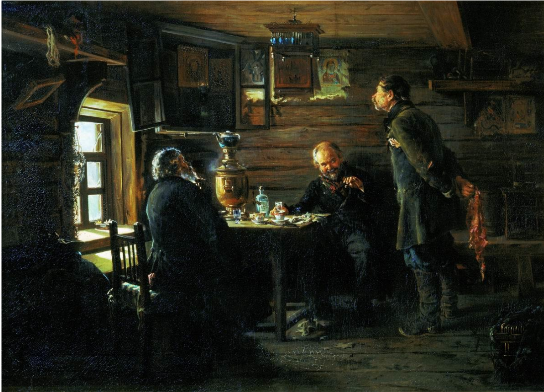
Vladimir E. Makovskij: Ljubiteli solov'inogo penija [1872-1873].

– lediglich auf der Grundlage der Bildbeschreibung kann der Leser den Kommentar zum Bild beurteilen. Doch schaut man sich das Original von Makovskij an, so fällt sofort die Diskrepanz zwischen dem Original und Dostoevskijs Bildbeschreibung auf: