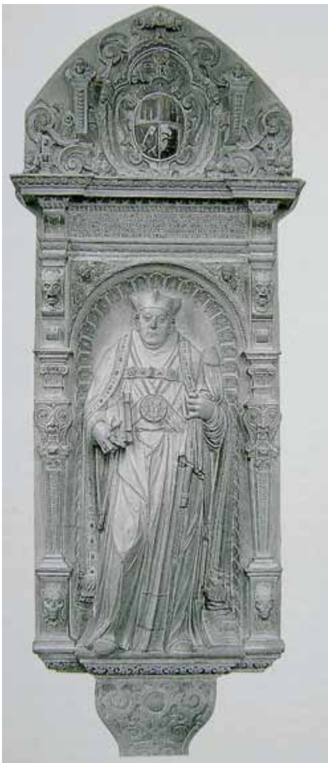
Taf. 3 Epitaph des Abtes Jakob Hess († 1614) im ehemaligen Kapitelsaal der Reichsabtei Marchtal. Abbildung: HELL, Melchior Binder (wie Anm. 39), Abb. 54.