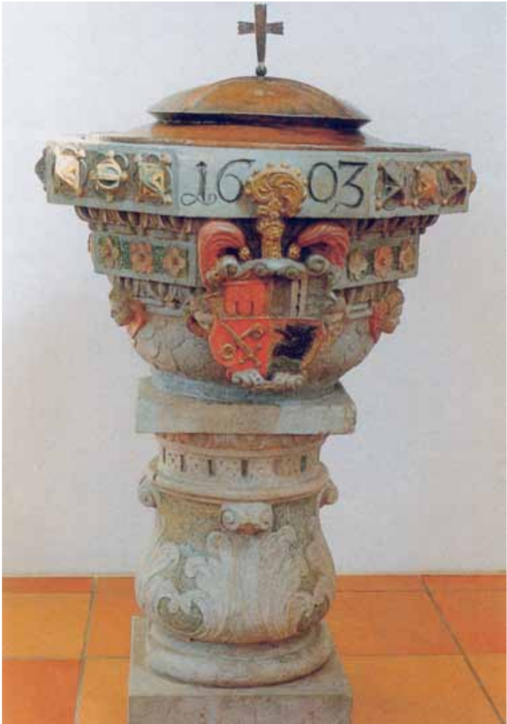
Taf. 1 Taufstein in der Pfarrkirche Reutlingendorf, 1603. Abbildung: 1200 Jahre Reutlingendorf (wie Anm. 34), nach S. 223.