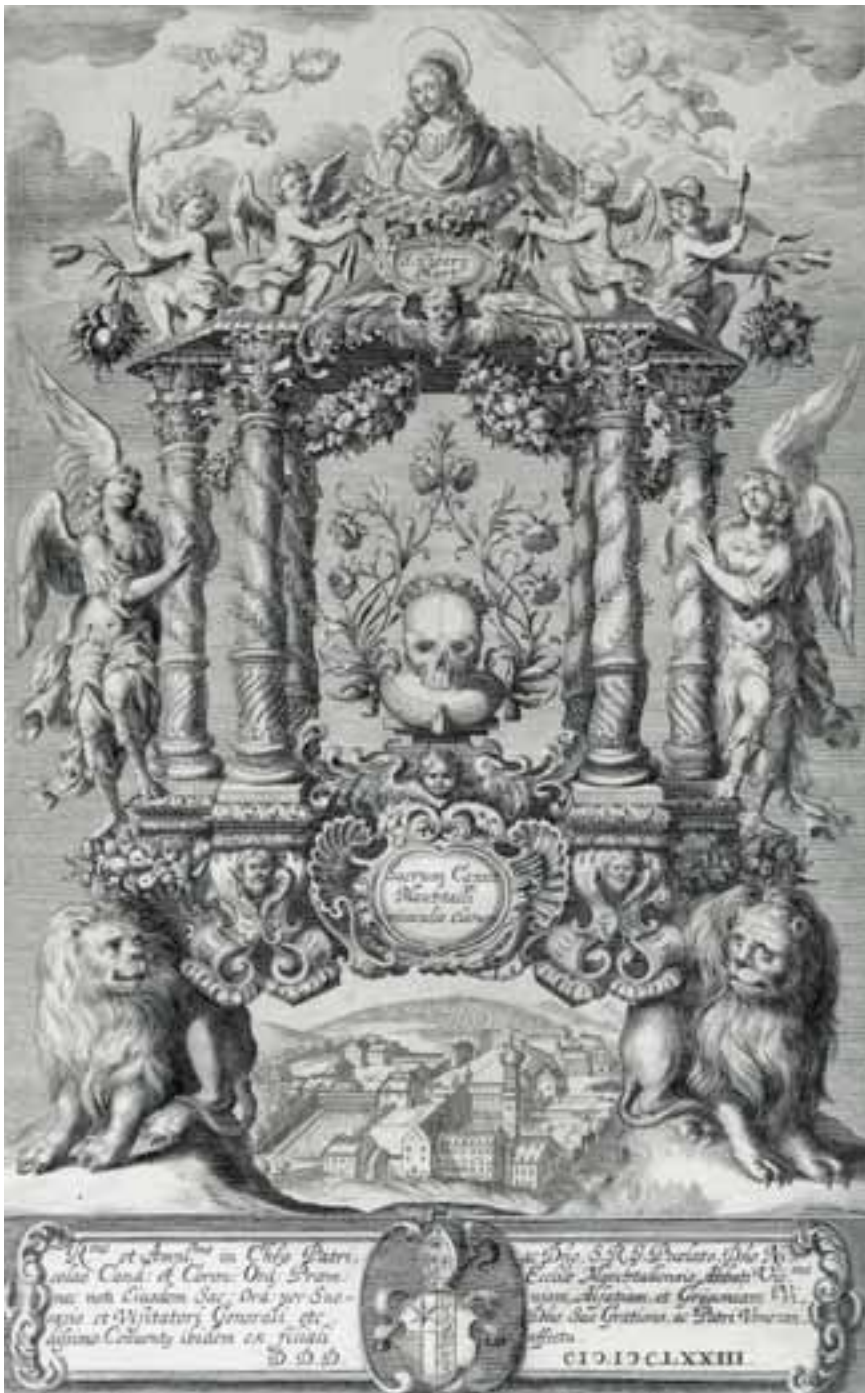
Taf. 8 Das Haupt des hl. Tiberius über der Stiftsanlage Marchtal. Wallfahrts- bild. Kupferstich, Augsburg 1673. Vorlage: Kreisarchiv des Alb-Donau-Kreises. – Abbildung: Regesten Marchtal (wie Anm. 30), Vorsatz.