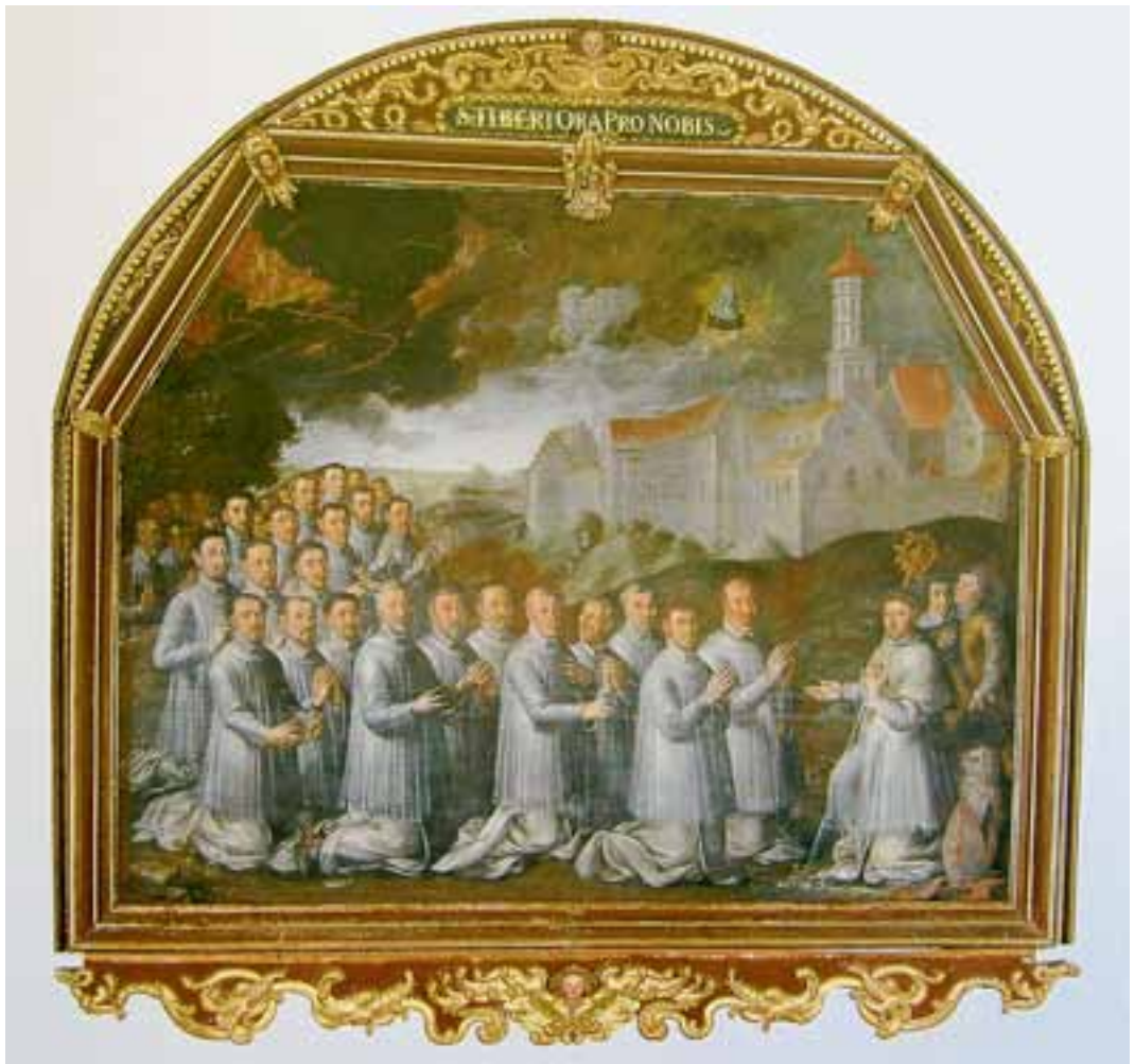
Taf. 7 Der hl. Tiberius rettet die Abtei Marchtal vor der Zerstörung durch ein Unwetter. Votivbild mit Portraits des Konvents und zweier weltlicher Beamter. Ölgemälde in der Sakristei der Stiftskirche Marchtal von Andreas Vogel, 1665. Abbildung: Marchtal (wie Anm. 31), Abb. 24.