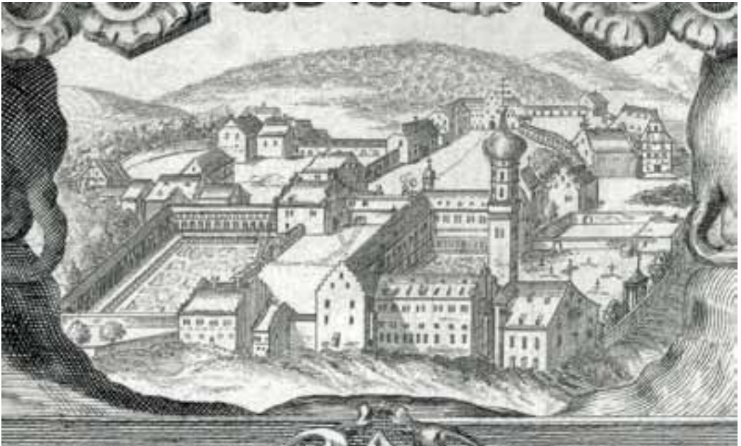
Taf. 9 Reichsabtei Marchtal von Norden. Die Stiftskirche liegt unmittelbar am Geländeabfall zum Marchbach, südlich grenzen der Kreuzgang (Kreuzgarten) und der Friedhof an. Im Osten liegt der große Konvents-Lustgarten mit den doppelgeschossigen Arkaden und dem kunstvoll angelegten Barockgarten. Im Süden und Osten schließen sich die Scheunen und andere Wirtschaftsgebäude an. Im Norden, am Hang zur Donau hin, liegt das »Hintere Haus« (Krankenhaus), zwischen dem Tor und den Arkaden das »Vordere Haus«, das durch einen Gang mit der neuen Prälatur verbunden ist, Kupferstich, Augsburg 1673 (Ausschnitt).