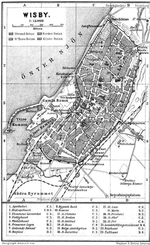
Abb. 1.3.1-1 – Karte über Visby, 1910.

Die Entstehung, Entwicklung und Funktion eines frühen Handels- und Siedlungsplatzes als Vorgänger zum mittelalterlichen urbanen Visby ist in der Forschung umstritten. 1 Aufgrund einer fassbaren langen Siedlungskontinuität im Umfeld von Visby und besonders aufgrund der großen Gräberfelder – nicht zuletzt Kopparsvik – ist mit Sicherheit davon auszugehen, dass der Bereich um Visby bereits in der Wikingerzeit intensiv genutzt wurde. Unsicher verbleiben dagegen einige Faktoren, wie die Frage nach der frühesten Datierung einer strukturierten, proto-urbanen Siedlung sowie des außer-