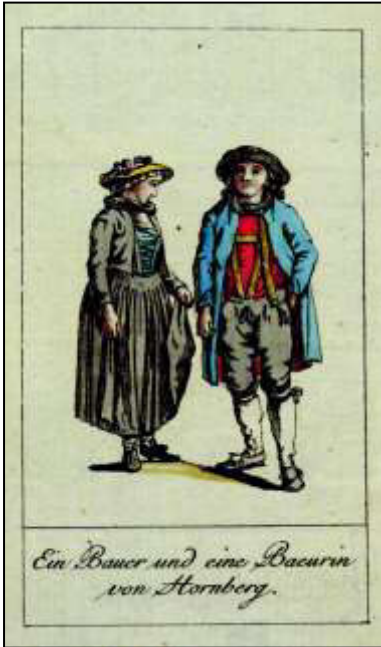
September: „Ein Bauer und eine Baeurin von Hornberg“

„Die 9te und die 10te Tafel zeigt uns Bewohner der tiefsten Thäler des Schwarzwalds. – An dem Bauer aus der Gegend von Hornberg bemerkt man einen frohen heiteren Sinn im ganzen Ausdruck des jungen Pütschen, und äusserst viel Grazie und Leichtigkeit in der Stellung des Mädchens.“