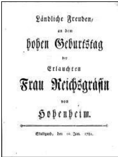
2 Ländliche Freuden. Theaterstück. Titelblatt, 1781