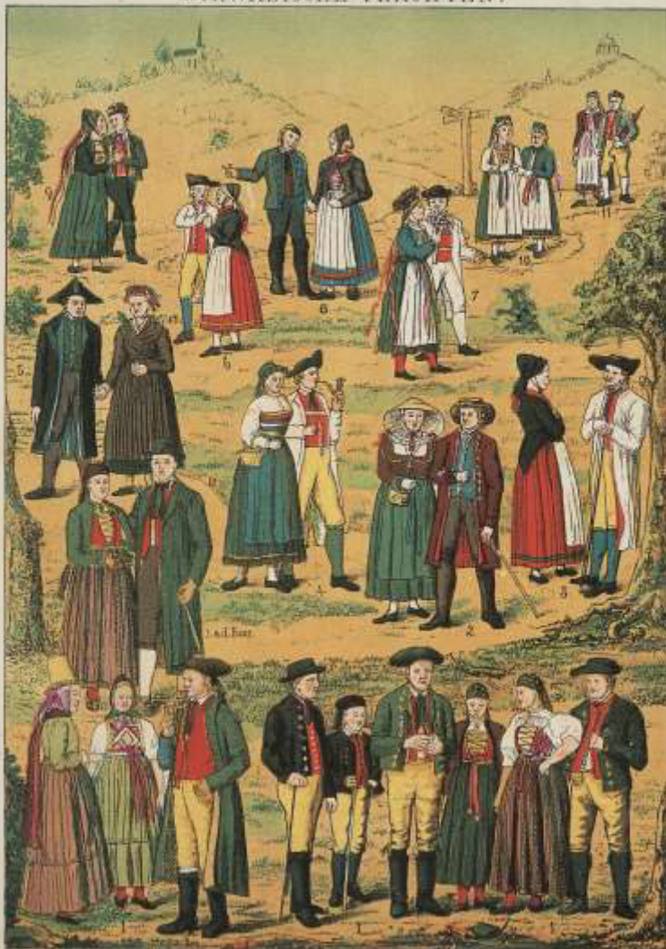
1. Oberzweil. 2. Ellertal. 3. Illerthal. 4. Lasterbach. 5. Heiden. 6. Amstetten. 7. Wehringen. 8. Heiden. 9. Mönchingen. 10. Stettin. 11. Kusteren.