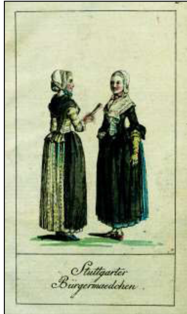
Februar: „Stuttgarter Bürgermaedchen“

„[...] kein Model aus der unglücklichen Mittelklasse zwischen deutsch und französisch, die im Grunde gar nichts eigenes hat, und bald für das eine, bald für das andere den Ausschluß gibt, sondern einen ächten geraden Mann von altem biederem Schlag.“