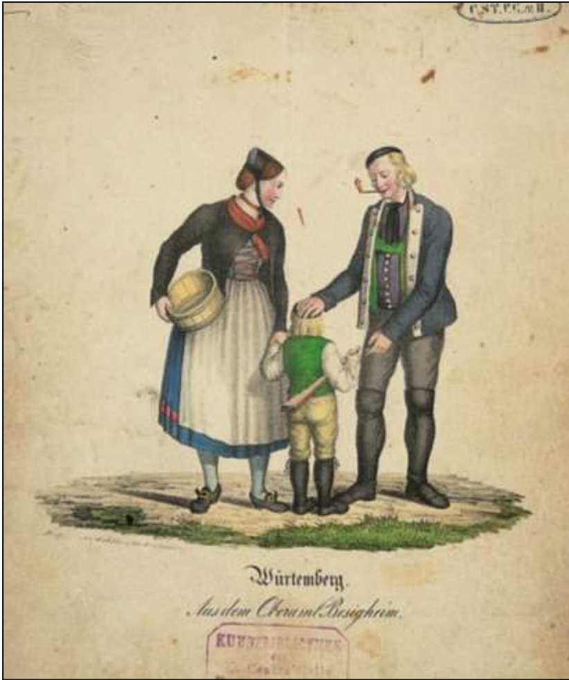
37 Württemberg. Aus dem Oberamt Besigheim. Verlag G. Ebner, ca. 1830