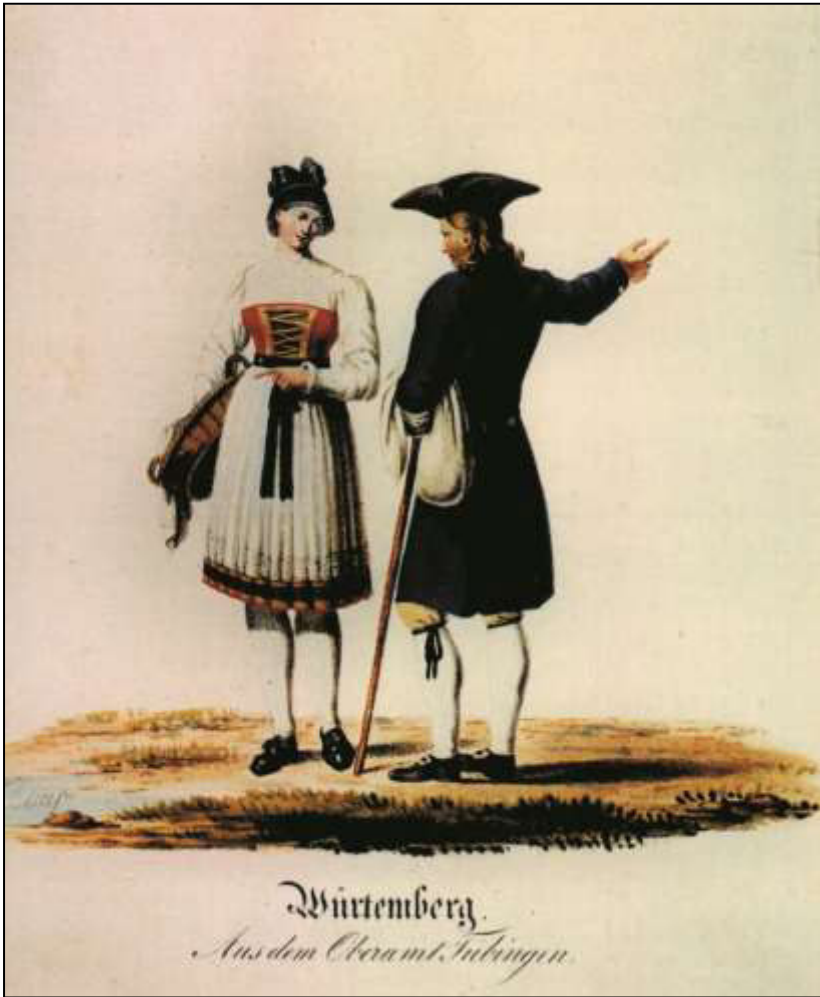
30 Württemberg. Aus dem Oberamt Tübingen. Verlag G. Ebner, ca. 1830