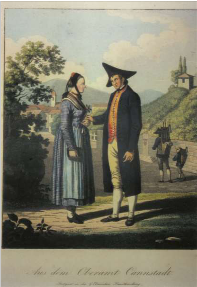
21 Aus dem Oberamt Cannstadt. Carl von Heideloff, 1824