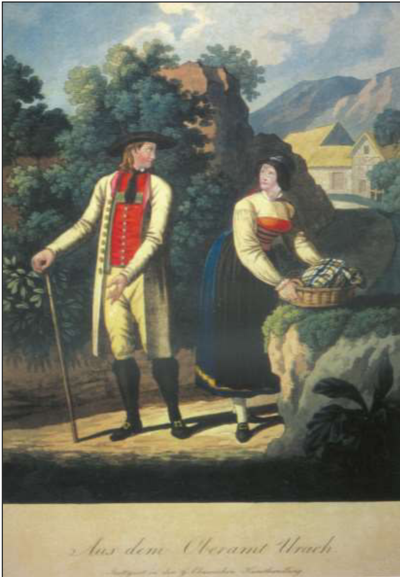
24 Aus dem Oberamt Urach. Carl von Heideloff, 1824