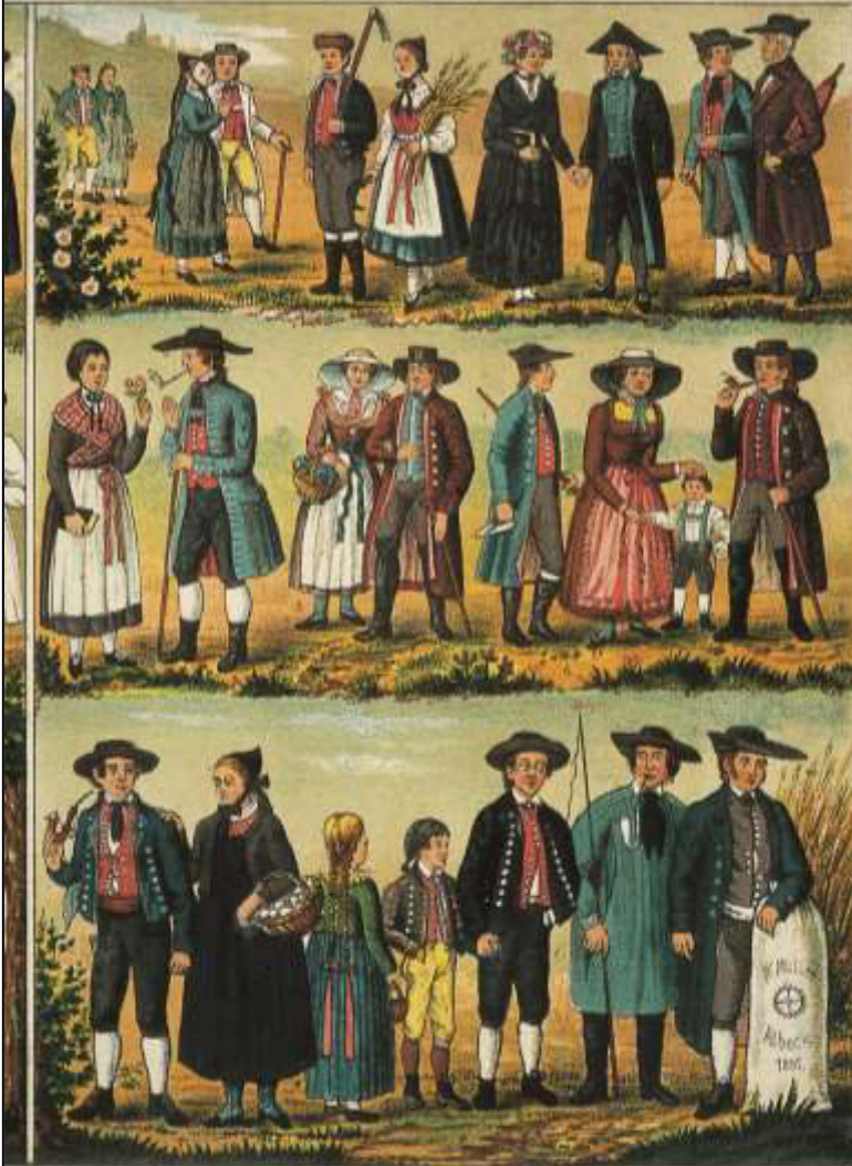
1. Alb 2. Nassenheim. 3. Jagst u. Kochertal 4. Biberach 5. Illertal 6. O.A. Leutkirch. 7. O.A. Ulm 8. Schwäbische Alb (Gosteten) Albuch.

46 Schwäbische Volkstrachten. Aus: Illustrierter Atlas des Kgrs. Württemberg. Verlag L. Rachel, 1888