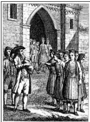
53 „Die Hochzeit-Procession“, Kalenderkupfer zum Monat Januar. Württembergischer Hofcalender, 1790

Von dort gelangten die Bilder in die dem späten Hofkalender thematisch verwandten, weiter entwickelten Landesbeschreibungen von Hausleutner, Röder und Memminger und wurden so einem größeren, auch ausländischen Publikum zugänglich. Das ökonomische Interesse der Verleger an der Illustration von Büchern und der Weiterverwertung bereits vorhandener Bildvorlagen führte dazu, dass die Motive als wirklichkeitsnah zertifiziert wurden, obwohl auf vorhandenes älteres Material zurück gegriffen worden war.