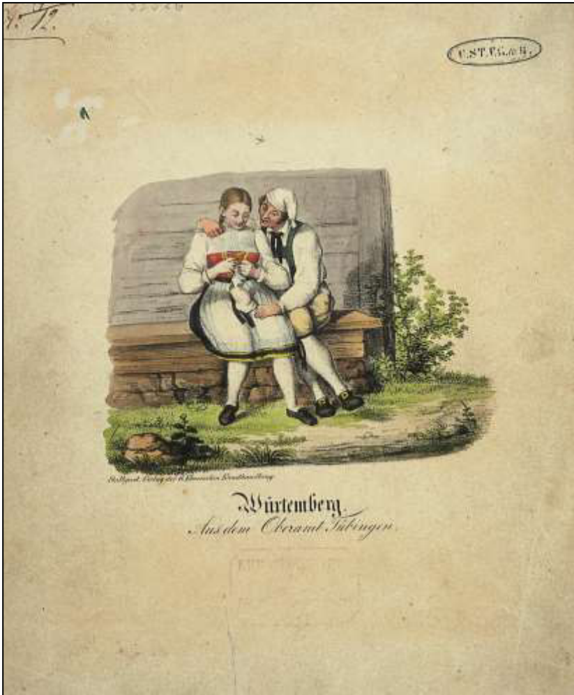
32 Württemberg. Aus dem Oberamt Tübingen. 2. Blatt. Verlag G. Ebner, ca. 1830