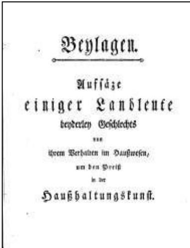
4 Beilagen zum Theaterstück: Ländliche Freuden, 1781