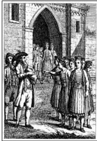
8 „Die Hochzeit Procession“ Kalender- kupfer zum Monat Januar. Württembergischer Hofcalender, 1790

Die Kunstgeschichte der Hohen Carlsschule ist noch nicht so gut aufgearbeitet, dass es Werkverzeichnisse für alle Künstler und für alle Kunst(hand)werke gäbe, so dass auf diesem Weg kein Künstler mit Vergleichbarem in dieser Zeit gefunden werden konnte. 268 Werkimmanent konnte die Suche nach der Urheberschaft ebenfalls nicht geklärt werden. Es gibt zwar einen vagen Bezug zu Philipp Hetsch, dessen italienisches Selbstportrait in der Figur eines Zuschauers auf dem Kalenderbild „Das Eier-