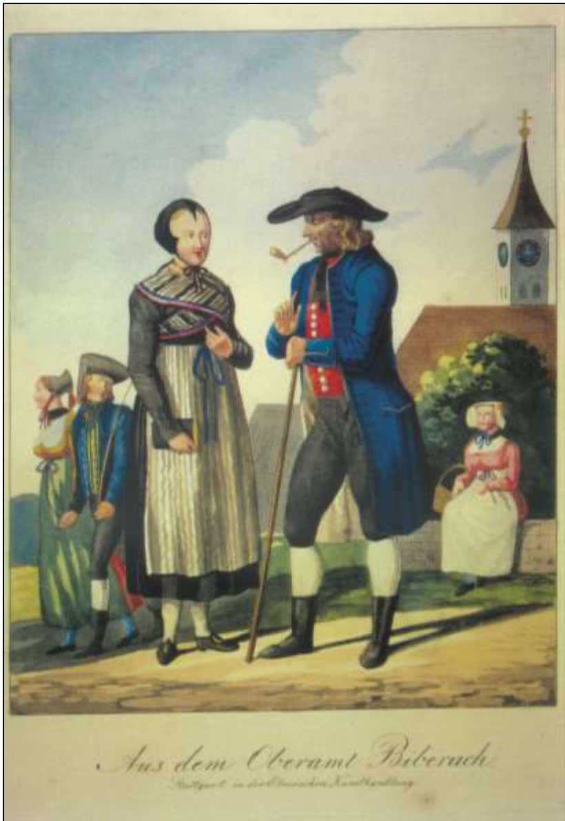
26 Aus dem Oberamt Biberach . Carl von Heideloff, 1824