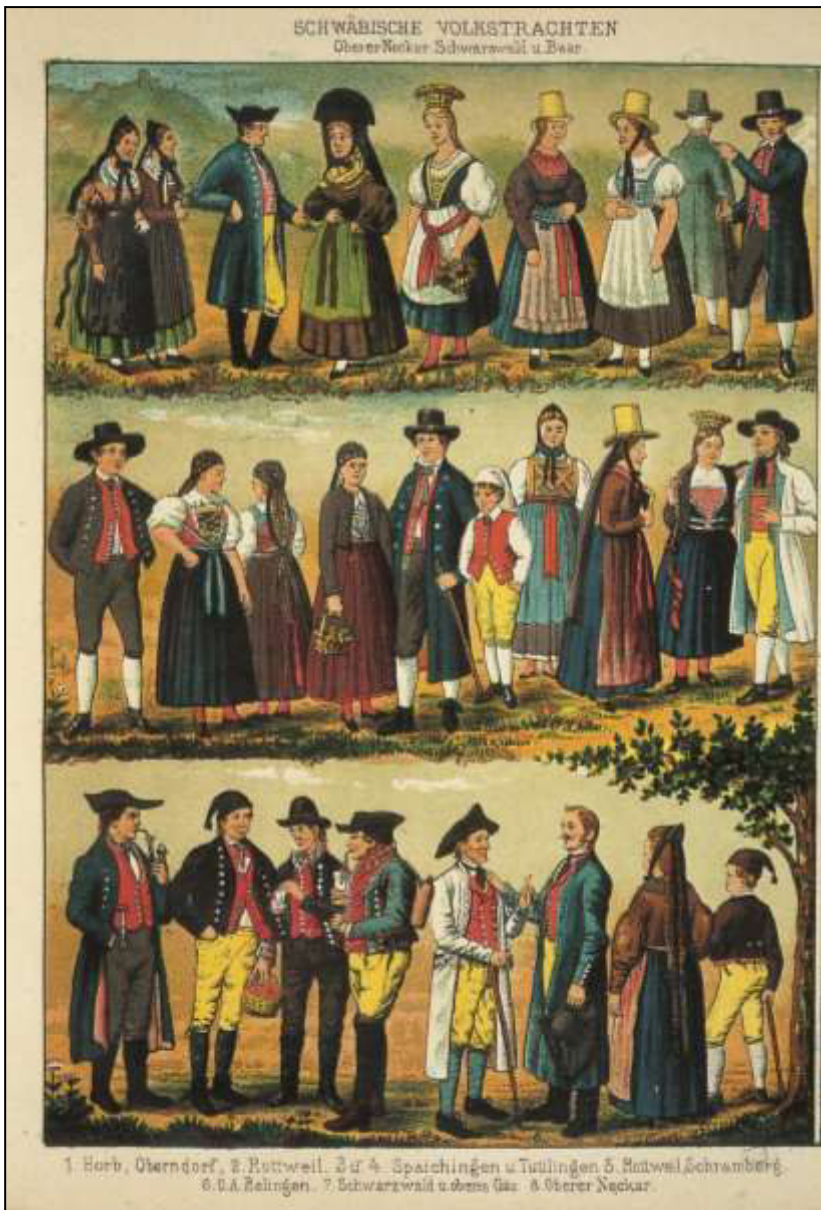
47 Schwäbische Volkstrachten. Aus: Illustrierter Atlas des Kgrs. Württemberg. Verlag L. Rachel, 1888