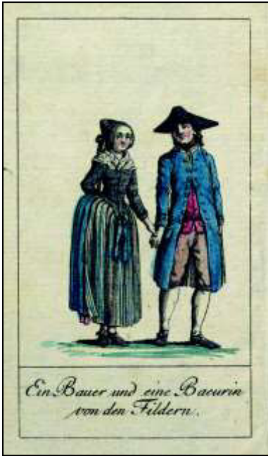
März: „Ein Bauer und eine Baeurin von den Fildern“

„Die Bauersleute sind aus der Gegend von Plieningen, Bernhausen und der Landsstrecke, gleich ob der Staig, die man die Filder nennt. Schon ein merklicher Unterschied zwischen dieser und der Stuttgarter Kleidung, aber immer noch – am Mädchen besonders – ächtes Kennzeichen von der Nachbarschaft der Hauptstadt,“