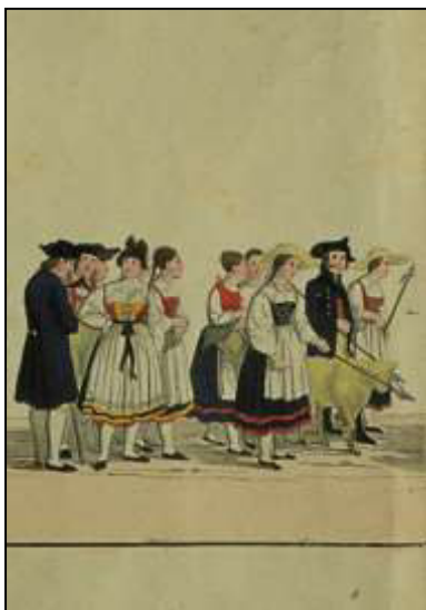
41 Festzug der Württemberger. Gruppe: Cannstatter Volksfest, Ausschnitt, 1842/43

Wurde der Hofkalender einst nur von einem relativ kleinen Publikum rezipiert und waren Heideloffs Entwürfe der königlichen Sammlung vorbehalten gewesen, so brachten schließlich die Ebnerschen Verkaufsserien eine Multiplikation an Betrachtern und leiteten eine Popularisierung der Bildmotive ein.