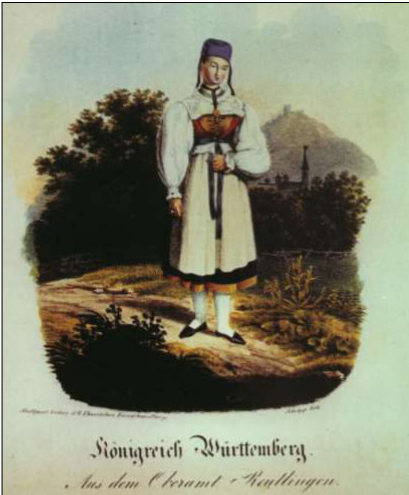
38 Königreich Württemberg. Aus dem Oberamt Reutlingen. Verlag G. Ebner, ca. 1830