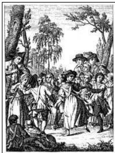
58 „Der Mayen-Tag“, Kalenderkupfer zum Monat Mai. Württembergischer Hofcalender, 1790