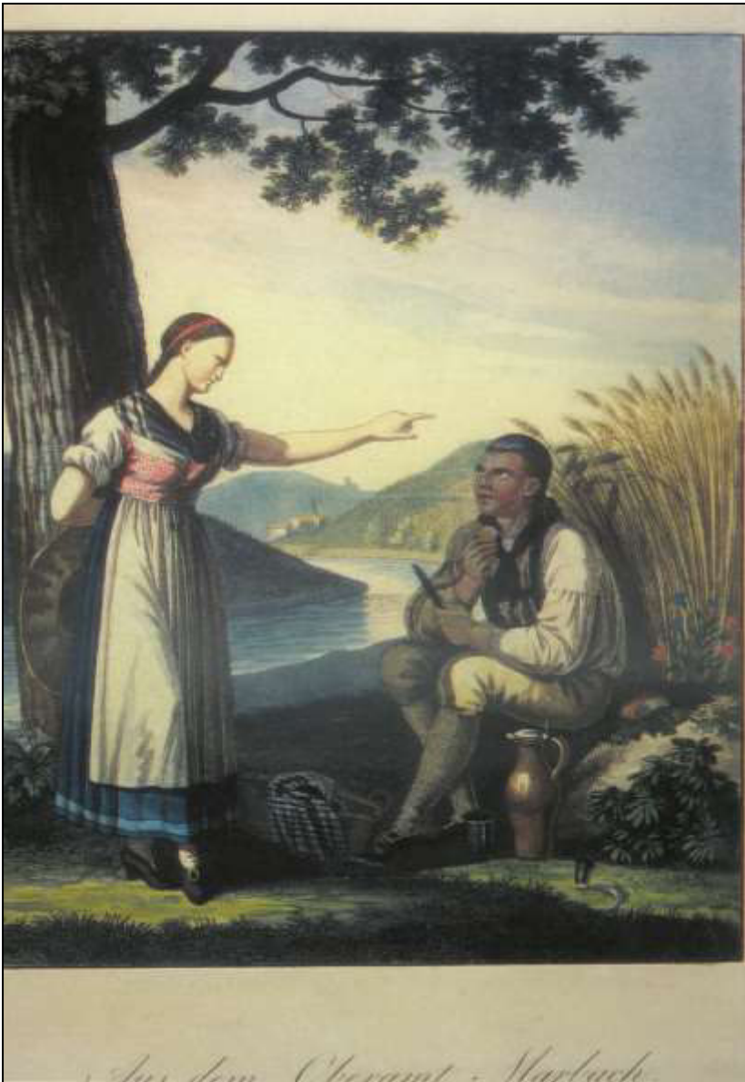
25 Aus dem Oberamt Marbach. Carl von Heideloff, 1824