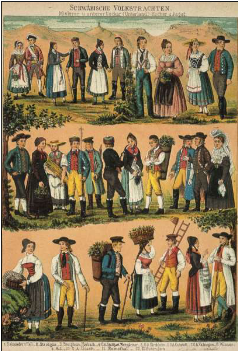
45 Schwäbische Volkstrachten. Aus: Illustrierter Atlas des Kgrs. Württemberg . Verlag L. Rachel, 1888