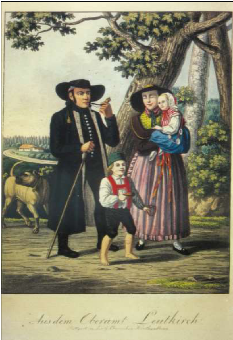
28 Aus dem Oberamt Leutkirch. Carl von Heideloff, 1824