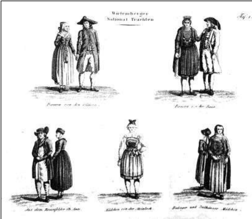
14 Neueste Kunde von dem Königreich Wirtemberg. Tafel 1, 1812

Die Ausstattung des Buches überrascht zunächst, denn Röders Publikationen waren bis dahin höchstens mit kleinen Vignetten illustriert. 314 Durch bibliographische Recherche konnte nachgewiesen werden, dass Röders