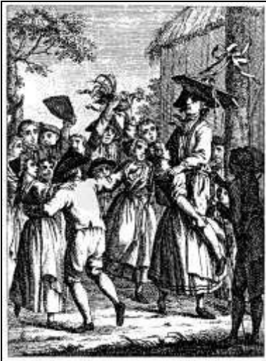
57 „Der Hahnentanz“, Kalenderkupfer zum Monat Juli. Württembergischer Hofcalender, 1790