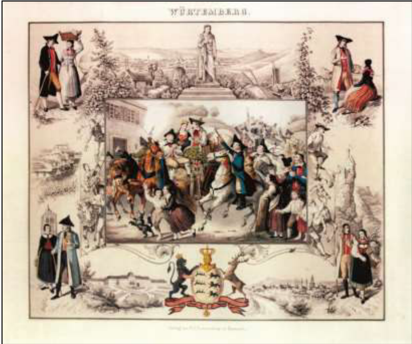
43 Württemberg. Nach L. v. Hohbach, 1847