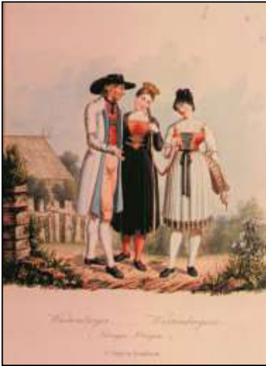
39 Württemberg – Wurtembergoise. Tübingen – Ebingen. Verlag C. Jügel, nach 1845

Wie Jügel an die Vorlagen der Heideloff-Serie kam, lässt sich nicht klären. Ebenso bleibt unklar, wer sie für ihn neu lithographierte, und das genaue Erscheinungsdatum. 361 Klar ist, dass die württembergischen Motive nicht die einzigen waren, die er kopieren ließ, auch bayerische Vorlagen sind nachweislich von ihm verwendet worden. 362 Jügel hat sich, und darin ähnelt er anderen Verlegern, einfach dort bedient, wo er passende, verkaufsträchtige Motive fand.