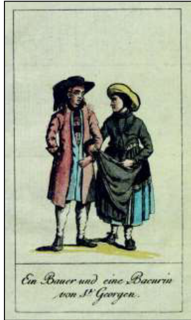
Oktober: „Ein Bauer und eine Baeurin von St. Georgen“

„Die 9te und die 10te Tafel zeigt uns Bewohner der tiefsten Thäler des Schwarzwalds. – An dem Bauer aus der Gegend von Hornberg bemerkt man einen frohen heiteren Sinn im ganzen Ausdruck des jungen Pütschen, und äusserst viel Grazie und Leichtigkeit in der Stellung des Mädchens.“