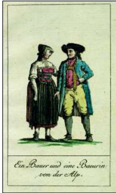
April: „Ein Bauer und eine Baeurin von der Alp“

„Die Bauersleute sind aus der Gegend von Plieningen, Bernhausen und der Landsstrecke, gleich ob der Staig, die man die Filder nennt. Schon ein merklicher Unterschied zwischen dieser und der Stuttgarter Kleidung, aber immer noch – am Mädchen besonders – ächtes Kennzeichen von der Nachbarschaft der Hauptstadt,“