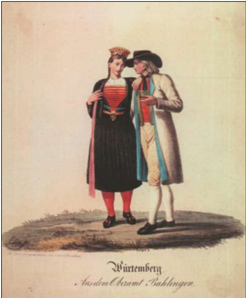
31 Württemberg. Aus dem Oberamt Bahlingen. Verlag G. Ebner, ca. 1830