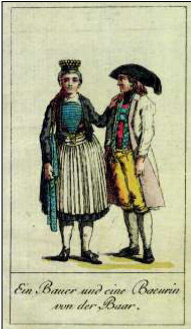
7 Kalenderkupfer zum Monat August. Württembergischer Hofcalender, 1789