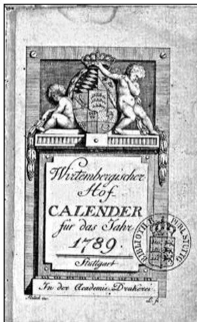
6 Württembergischer Hofkalender. Titelblatt, 1789

In den „Vaterländischen Gegenständen“ müssen sie eine Verknüpfung ihrer eigenen Vorstellungen mit denen von Carl Eugen und der von ihm etablierten Hofhaltung, wie sie das vorige Kapitel erläuterte, gesehen haben. Die auf dem Höhepunkt der „ländlichen Fête“ aufgetretenen Landleute in Orginalkostümen fanden so wahrscheinlich Eingang in den Hofkalender als „Wirtembergische Trachten“, und die vorgeführten Tänze, wie die Feiern zur Sichelhenke, gaben den Impuls zur Reihe der „National-Gebräuche und Ergötzlichkeiten des Wirtembergischen Landvolkes“ und finden sich dort als Motive wieder (mit ihnen wird sich das folgende Kapitel „Abbildungen“ beschäftigen).