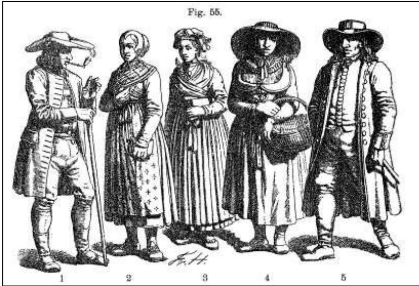
50 Deutsche Volkstrachten. Württemberg. Friedrich Hottenroth, 1898