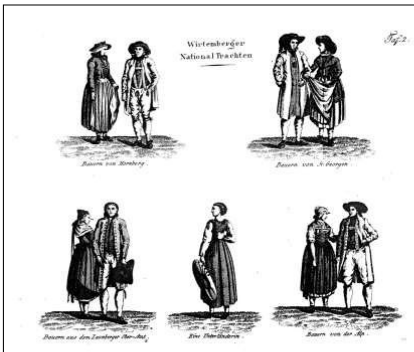
15 Neueste Kunde von dem Königreich Württemberg. Tafel 2, 1812

Landeskunde als Teil einer umfangreichen Reihe erschienen war, in der er selbst für eine bayerische Landesbeschreibung 315 als Autor nochmals tätig gewesen war und in der auch die einzelnen Bände vom Herausgeber in der gleichen Weise ausgestattet worden waren: mit Karten und Kupfertafeln. Letztere waren mit zwei oder mehr Blättern den jeweiligen sogenannten Nationaltrachten 316 gewidmet.