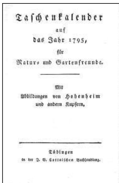
5 Taschenkalender für Natur- und Gartenfreunde. Titelblatt, 1795

Die Erweiterung und Umgestaltung der vorhandenen Anlagen wurden zur gemeinsamen Lebensaufgabe. Die gemeinsamen Reisen der Jahre 1774/75 und 1776 nach Italien, Frankreich und England mit der Besichtigung der Stätten des Altertums und der Schloss- und Gartenanlagen in Frankreich, insbesondere aber in England mit den Kew-Gardens, gaben den Anstoß zu eigenen Ideen. Mehrere Leitgedanken lagen der Gestaltung der Hohenheimer Anlagen zu Grunde, eine ganz eigene Interpretation der Reiseerfahrungen und der zeitgemäßen Landschaftsplanung.