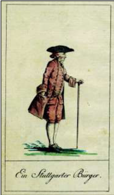
Januar: „Ein Stuttgarter Bürger“

Im Nachfolgenden sollen die zwölf Tafeln von 1789 mit dem ihnen zuzuordnenden Kommentaren aus dem Textteil des Kalenders, vorgestellt werden.