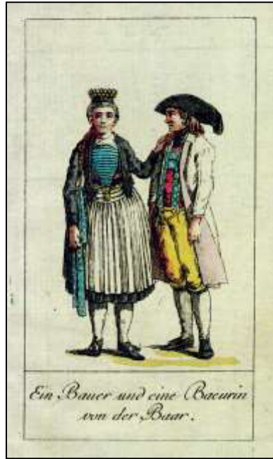
August: „Ein Bauer und eine Baeurin von der Baar“

„Die beiden folgenden Tafeln verrathen ganz deutlich die Nachbarschaft der Schweiz. Harmlose Selbstzufriedenheit herrscht in dem Blike des Alten.“