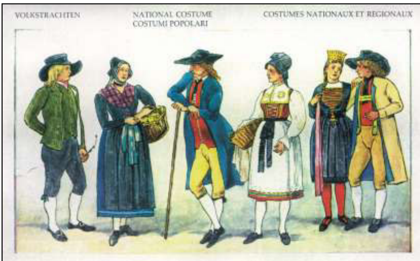
51 Volkstrachten. Württemberg. Bruhn/Tilke, 1941