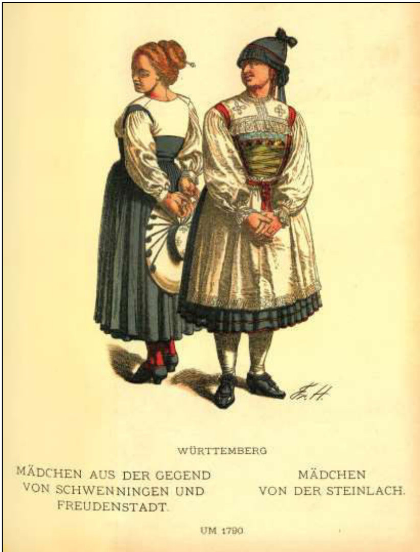
49 Deutsche Volkstrachten. Württemberg. Friedrich Hottenroth, 1898