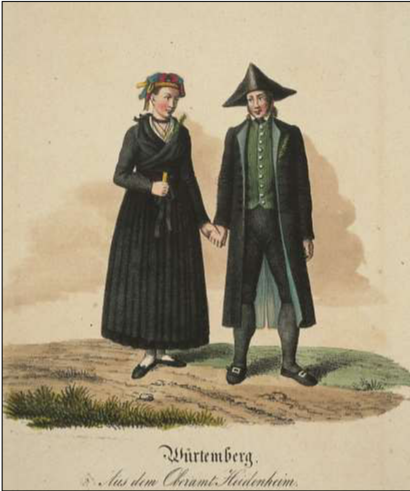
36 Württemberg. Aus dem Oberamt Heidenheim. Verlag G. Ebner, ca. 1830