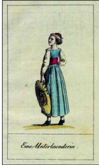
Dezember: „Eine Unterländerin.“

„An den Leonberger Bauersleuten verkennt man gewis nicht die Nähe der Hauptstadt; polierter als die vorherigen, aber auch steifer in Miene und Haltung.“