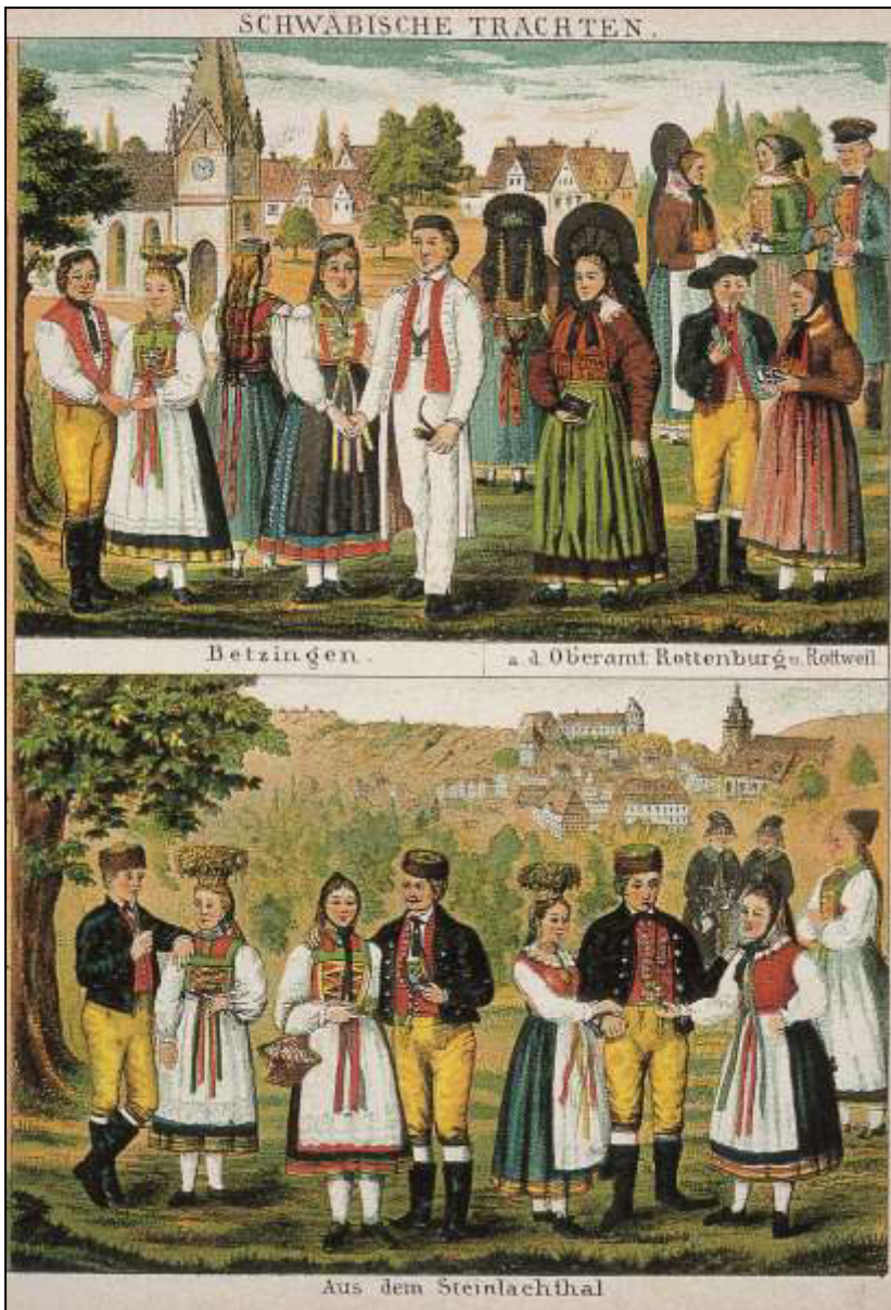
48 Schwäbische Trachten. Aus: Illustrierter Atlas des Kgrs. Württemberg . Verlag L. Rachel, 1888