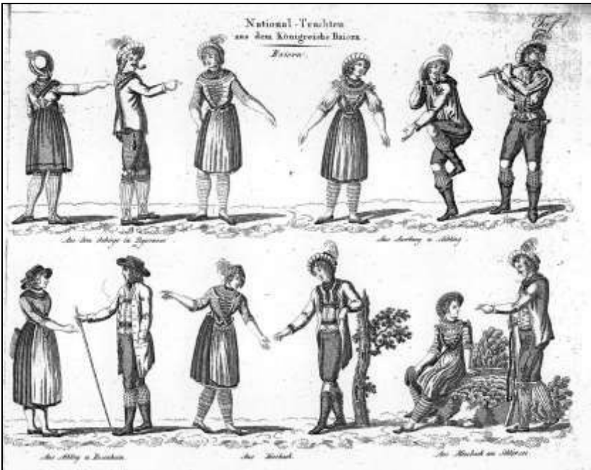
16 Neueste Kunde von dem Königreich Baiern. Tafel 1 (1822)

Darüber hinaus finden sich in beiden Fällen keine Angaben über die Ausführenden. 323 Kraus selbst hatte noch zu Lebzeiten eine Sammlung von Nationaltrachten publiziert, auf die für die Illustrationen der Landesbeschreibungen möglicherweise zurückgegriffen wurde. 324