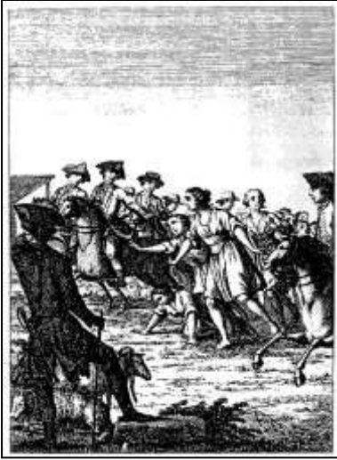
55 „Der Schäfer-Lauf“, Kalenderkupfer zum Monat August. Württembergischer Hofcalender, 1790