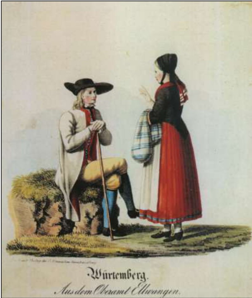
33 Württemberg. Aus dem Oberamt Ellwangen. Verlag G. Ebner, ca. 1830