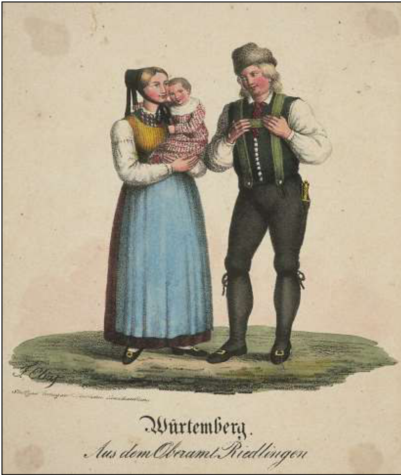
34 Württemberg. Aus dem Oberamt Riedlingen. Verlag G. Ebner, ca. 1830