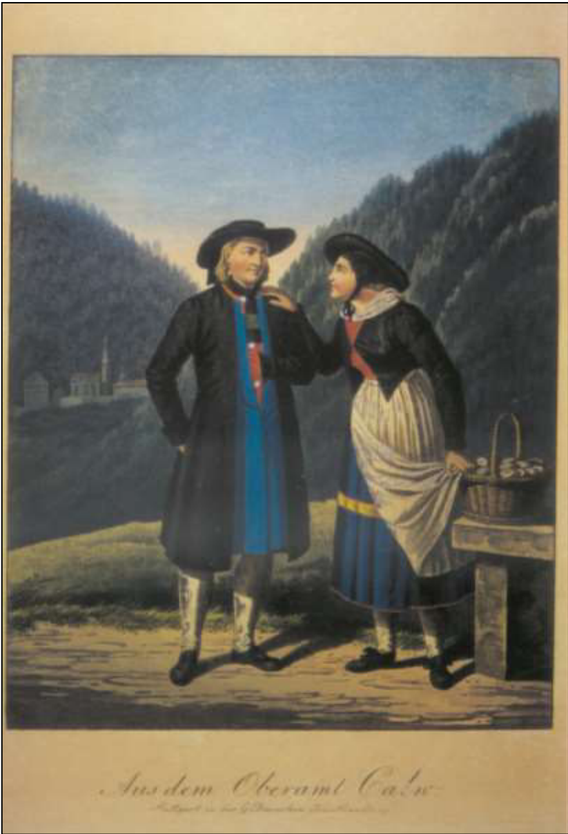
22 Aus dem Oberamt Calw. Carl von Heideloff, 1824