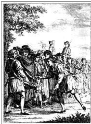
10 „Das Eier Lesen“ Kalenderkupfer zum Monat April. Württembergischer Hofcalender, 1790

So war die Frage nach den Ausführenden letztlich nur durch die Rechnungsbücher der Kupfer- und Buchdruckerei der Hohen Carlsschule lösbar. 270 Hier fehlen zwar ausgerechnet die Abrechnungen für den Hofkalender von 1789, aber die folgenden Jahrgänge sind als Kostenfaktoren in den Akten nachvollziehbar. 271 Aus ihnen geht hervor, dass Victor Heideloff die Entwürfe sowohl für die Reihe der Gebräuche (1790) als auch der Gardelegion (1791) erstellt hat und Miniaturmaler und Kupferstecher Louis