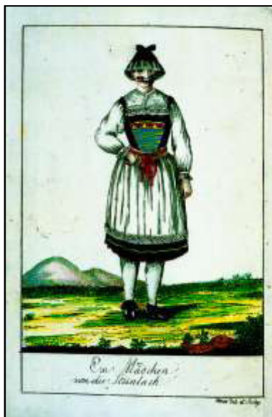
13 Schwäbisches Archiv. 2. Band, 1793

aber nicht daran, die Abbildung als „von einem geschickten Künstler an Ort und Stelle genommen, und von Personen, die sich lange in diesen Gegenden aufgehalten haben, sorgfältig berichtet“ 311 zu bezeichnen, obwohl es sich streng genommen um eine Arbeit nach einer Blattvorlage handelte, also nicht einmal im akademischen Sinne nach der Natur gezeichnet wurde. Hausleutners Vorgehensweise belegt nicht nur den knappen Finanzrahmen seines Vorhabens, sondern vor allem, dass sich das beanspruchte Realitätspostulat der Abbildungen als Argumentationsstrategie in der landeskundlichen Literatur durchsetzte.