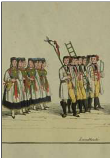
42 Festzug der Württemberger. Gruppe: Landleute von Reutlingen und Tübingen, Ausschnitt, 1842/43