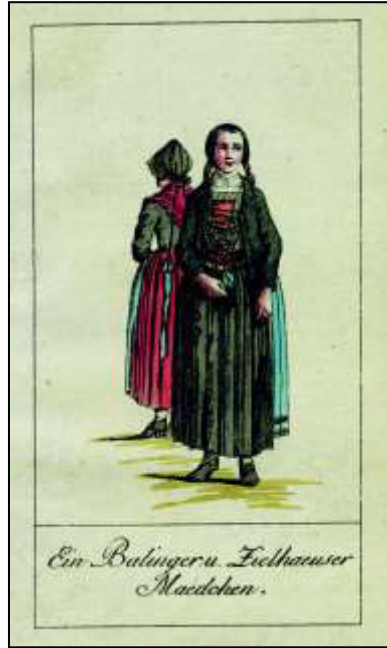
Juni: „Ein Balingen u. Zielhause Maedchen“

„Auffallender aber ist der Unterschied an dem Steinlacher Mädchen aus der Gegend von Mössingen, Ofterdingen und den benachbarten Orten; ganz geschmackvoll und dem Künstler sehr gut geraten.“