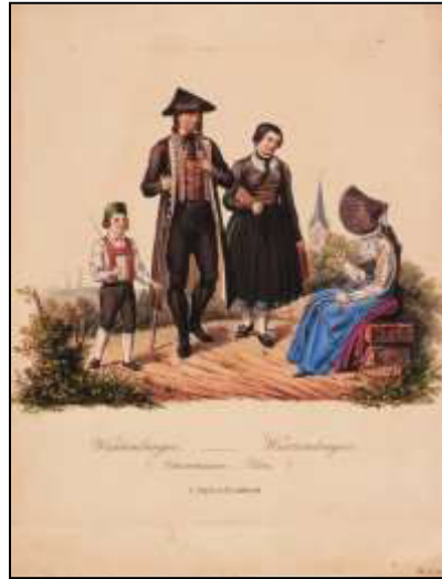
40 Württemberg – Wurtembergoise. Ochsenhausen – Ulm. Verlag C. Jügel, nach 1845