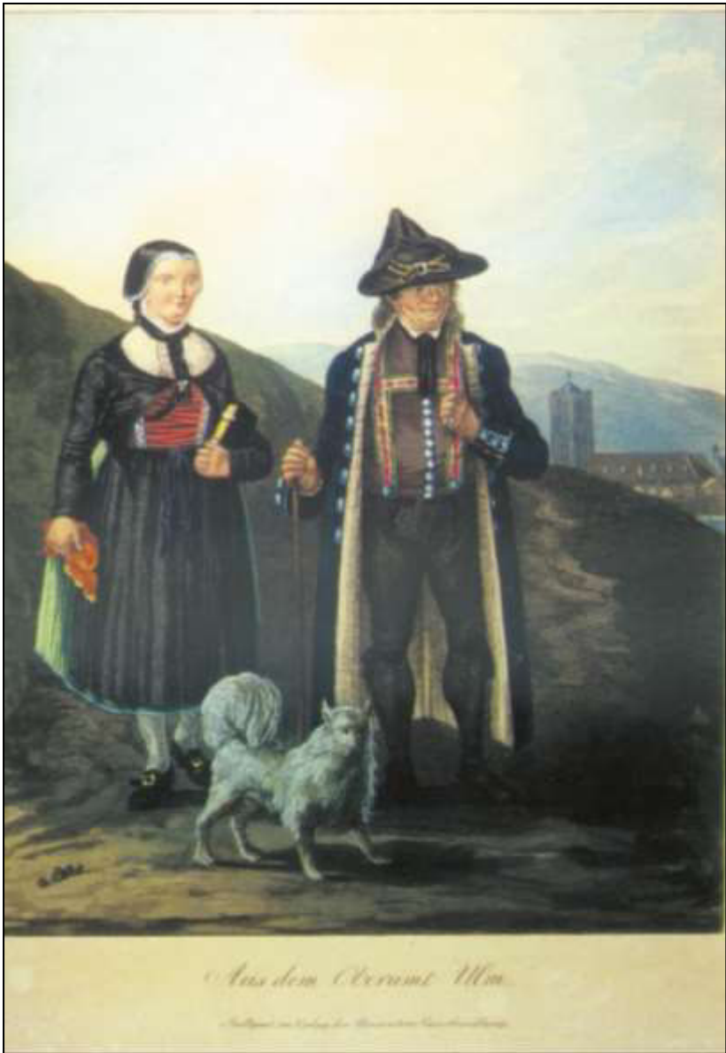
27 Aus dem Oberamt Ulm. Carl von Heideloff, 1824