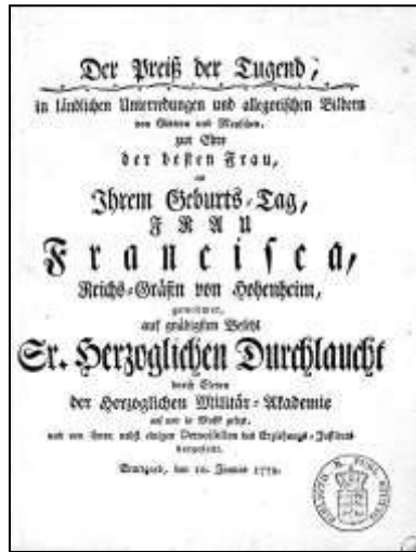
3 Der Preis der Tugend. Theaterstück. Titelblatt, 1779