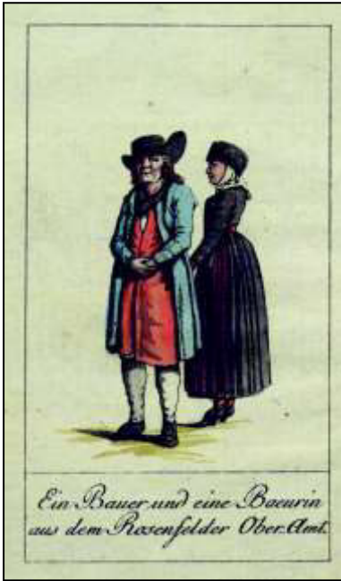
Juli: „Ein Bauer und eine Baeurin aus dem Rosenfelder Ober-Amt“

„Die beiden folgenden Tafeln verrathen ganz deutlich die Nachbarschaft der Schweiz. Harmlose Selbstzufriedenheit herrscht in dem Blike des Alten.“