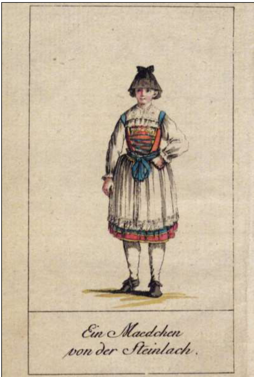
12 Kalenderkupfer zum Monat Mai. Württembergischer Hofcalender, 1789