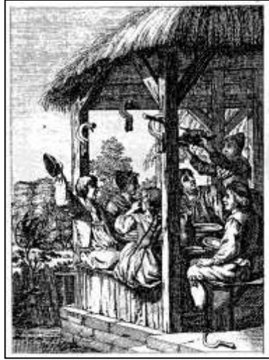
56 „Das Sichelhaengen“, Kalenderkupfer zum Monat September. Württembergischer Hofcalender, 1790