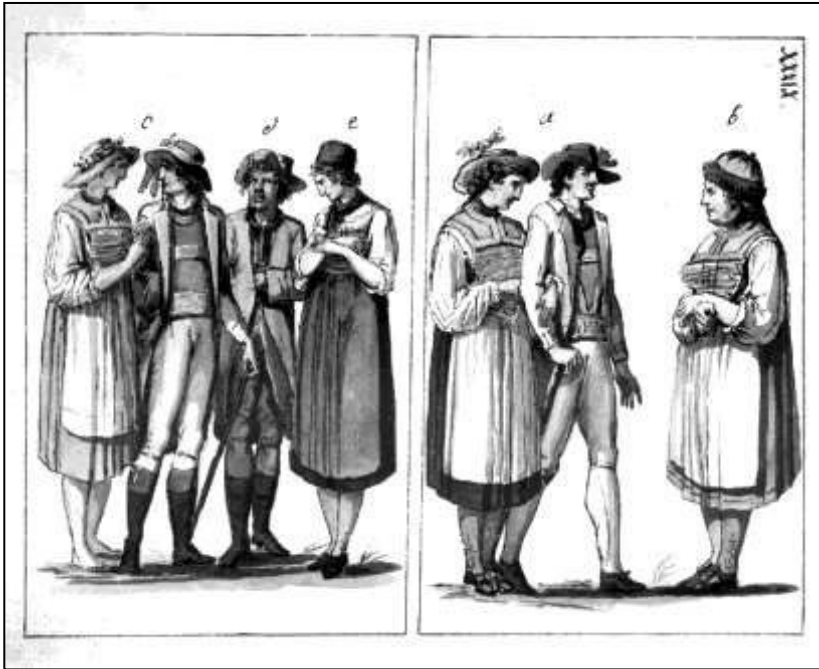
52 Trachten der Einwohner der Gegend. J. A. Koch, Reisetagebuch, 1791

Die erste Durchführung davon waren die Hofkalender von 1789 mit dem Thema der Nationaltrachten und von 1790 mit dem Thema der Nationalbräuche. Eine gemeinsame Betrachtung beider Serien zeigt auch hier die Koppelung von erwünschten Kleidungsformen und Verhaltensformen. Diese Doppelfunktion war in den Präsentationsformen Carl Eugenscher Prägung ja bereits enthalten und wurde hier weiter geführt. So wie bei den Trachten die Peripherien des Landes bevorzugt wurden, so wurden es bei den Bräuchen die Schauseiten des Landlebens (konsequenterweise sind die Betrachter auch schon mit auf dem Bild): Hochzeit, Sichelhenke, Hahnenanzug. (Abb. 53–58, Auswahl) Hier versuchten die Kalendermacher, die zur nicht-klerikalen Bildungselite des Landes 368 zählten, den Horizont zu füllen, indem sie die höfischen mit den bürgerlich-aufklärerischen, von ihnen „vaterländisch“ genannten Themen der Landesbeschreibung und Landesethnographie verbanden.