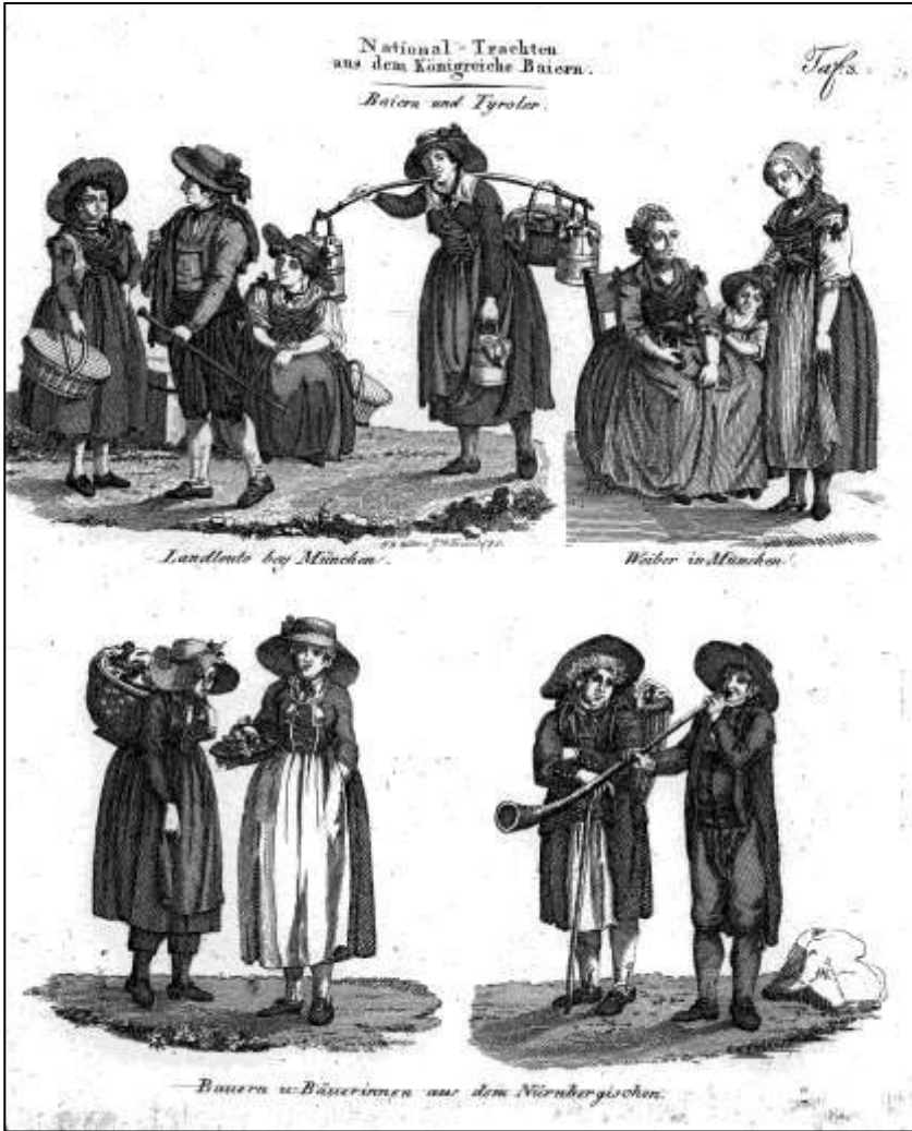
17 Neueste Kunde von dem Königreich Baiern. Tafel 3, 1812