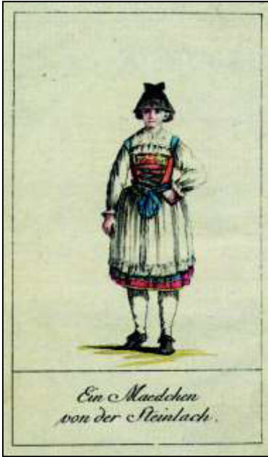
Mai: „Ein Maedchen von der Steinlach“

„Auffallender aber ist der Unterschied an dem Steinlacher Mädchen aus der Gegend von Mössingen, Ofterdingen und den benachbarten Orten; ganz geschmackvoll und dem Künstler sehr gut geraten.“