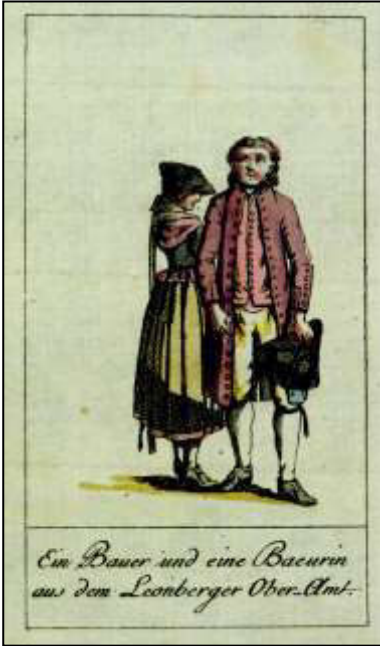
November: „Ein Bauer und eine Baeurin aus dem Leonberger Ober-Amt“

„An den Leonberger Bauersleuten verkennt man gewis nicht die Nähe der Hauptstadt; polierter als die vorherigen, aber auch steifer in Miene und Haltung.“