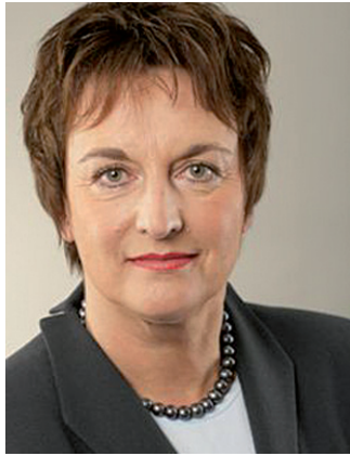
Brigitte Zypries, MdB Bundesministerin der Justiz Präsidentin des Kuratoriums der Stiftung Deutsches Forum für Kriminalprävention

Über 23 Millionen Menschen engagieren sich in Deutschland ehrenamtlich in Vereinen, Gemeinden und Initiativen. Viele von Ihnen setzen sich für die Kriminalprävention ein. Ein guter Grund, den 13. Deutschen Präventionstag ganz dem ehrenamtlichen Engagement für eine sichere Gesellschaft zu widmen.