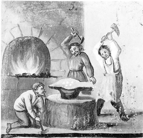
Die hl. Hostien werden auf dem Kubos geschlagen.