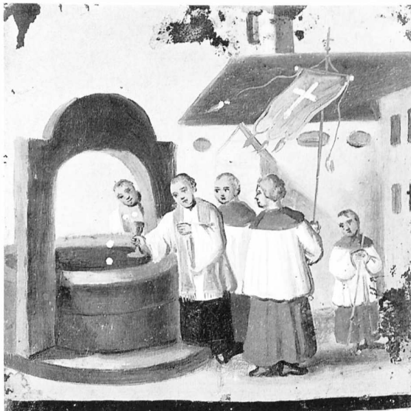
Die hl. Hostien werden wieder gefunden.