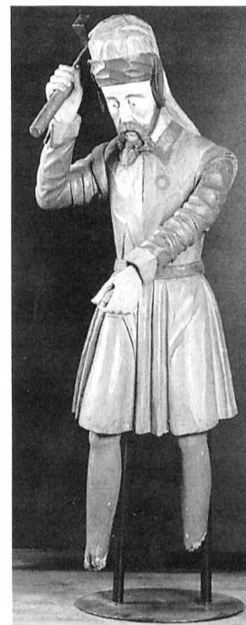
Figur aus dem Deggendorfer »Judentaler«, einen auf die Hostie einstechenden Juden darstellend. (83)

»Ach was, ich rede deutsch und sag es offen: wär besser euer Moses im Nilschlamm ersoffen und Abram, Isaak und Jakob dazu, dann hätte die Welt vor euch Judenpack Ruh.« 14