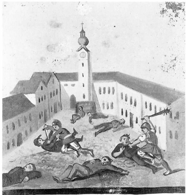
Im Jahre 1337 werden alle Juden erschlagen.