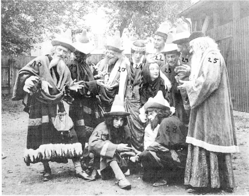
Ensemble des Deggendorfer Spiels »Das heilige Mirakel«, 1926. (78)