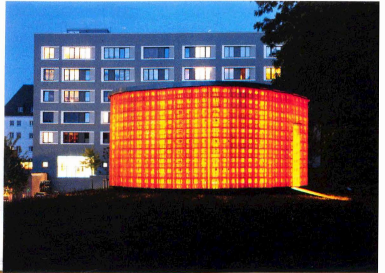
Winter/Hörbelt, Kastenhaus für Sankt Georgen, 2012/13. Kabel, Kästen, Schrauben, Holz, Folie. Das Künstlerteam versteckt die industriell hergestellten Materialien nicht hinter künstlerischer Bearbeitung: „Das Haus ist, was man sieht“ sagt Winter – und eröffnet neue, ungeahnte Räume