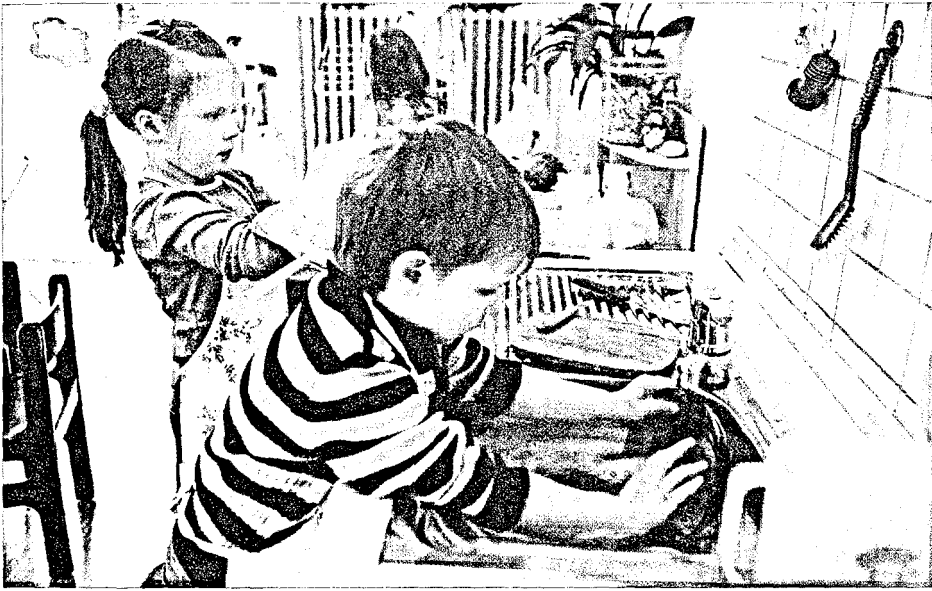
Gemeinsames Tun – auch bei den Kindern ein wichtiger Grundsatz

penkasse und finanziert beispielsweise den nächsten Ausflug. Das Elternbistro ist ein fester sozialer Treffpunkt geworden: die Eltern, die Kinder bringen oder abholen, trinken etwas oder essen eine Kleinigkeit und sitzen mit anderen zusammen. Manche nicht erwerbstätige Mütter oder Väter verbringen schon mal auch den ganzen Vormittag dort. Und in der Nachbarschaft weiß man: Hier gibt es freitags leckere Sachen zum günstigen Preis.