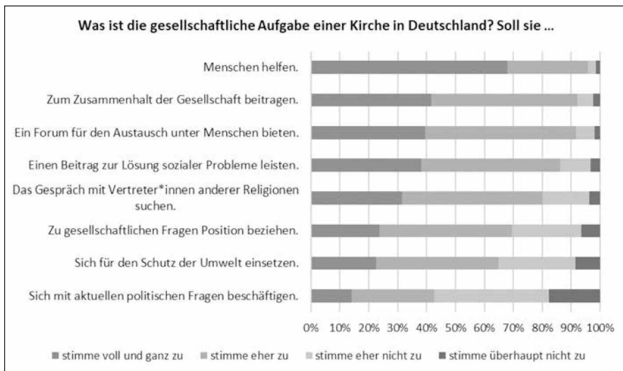
Abbildung 1: Die gesellschaftliche Aufgabe einer Kirche (Frage 78, n=641)

In der oben beschriebenen EKD-Studie (Erhebung von 2020) sind nun verschiedene Dimensionen kirchlichen Handelns im gesellschaftspolitischen Feld erfragt worden, und zwar bezogen auf konkrete Engagementbereiche und aktuelle Herausforderungen und mit vier Antwortmöglichkeiten, was eine Positionierung zwischen den Feldern von Zustimmung und Ablehnung erzwingt. In der folgenden Abbildung sind diese nach Zustimmungswerten sortiert.