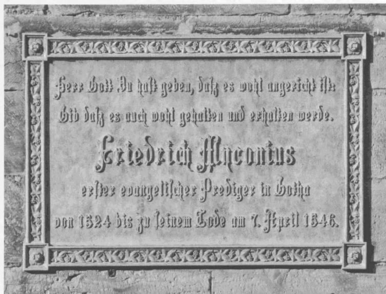
▲ Myconius-Gedenktafel an der Augustinerkirche