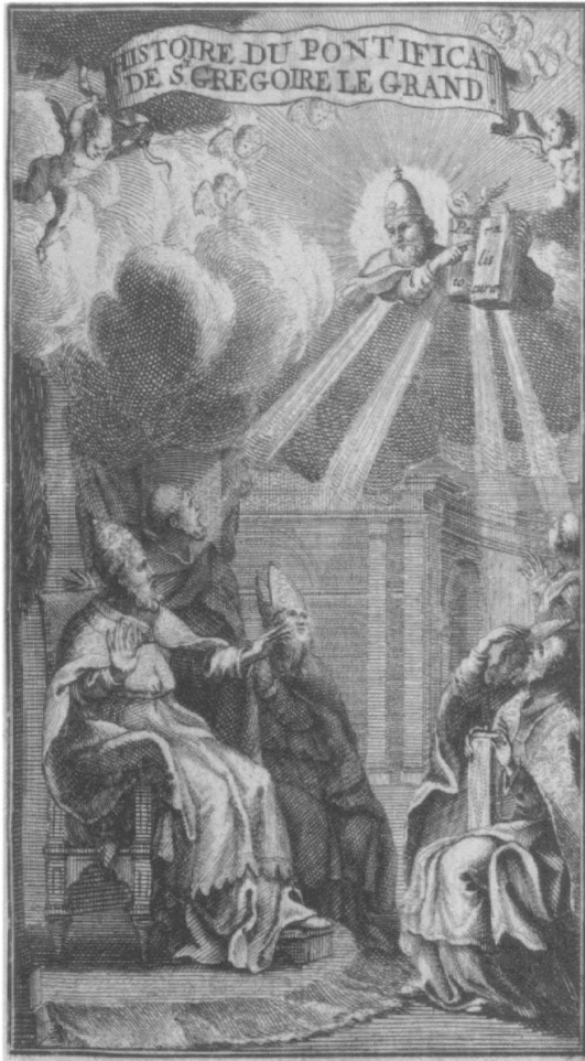
Abb. 14: Louis Maimbourg: Histoire Du Pontificat De S. Gregoire Le Grande. [Amsterdam] 1686. FB Gotha, Hist. 8° 4764/1, Titelpuffer.

geblich dienen sie mir, dieweil sie lehren solche Lehre, die nichts denn Menschen=Gebote sind, Matth. XV. v.9. ists nun cultus ἀγραφος [ungeschriebener Kult], den Gott nirgends geboten, sondern die Menschen haben ihn nur nach ihrem eigenen Willen erdichtet, so ist ja nichts anders, als ἐθελοθησκεία [Eigenwille], Coloss. II. v.18 [...]. 21 Ebenso klassisch protestantisch ist die Schlussfolgerung, dass Feiertage in christlicher Freiheit angeordnet werden könnten, aber dann ausschließlich zur Ehre Gottes und zur Erbauung der Gemeinde: „und wer davor hält, daß solche unnöthige ceremonien Gottes Ehre und die Andacht oder Erbauung befördern, der giebt damit zu verstehen, daß es eben so gar unrecht nicht sey, wenn man im Pabstthum so mancherley Gauckeleyen bey Messen, oder Processionen, treibt“. 22 Die Berufung auf die Kirchenordnung zählt hier nicht, weil diese als Menschenwerk der Heiligen Schrift untergeordnet und an dieser zu prüfen ist, „sonst ists päbstisch, wie der sel. Gerhardus in seiner Confessione catholica lib. II. art. 3. c. 7 [...] deutlich erweist.“ 23 Mit dem Bezug auf Gerhard riskiert Wetzel viel, denn er unterstellt sei-