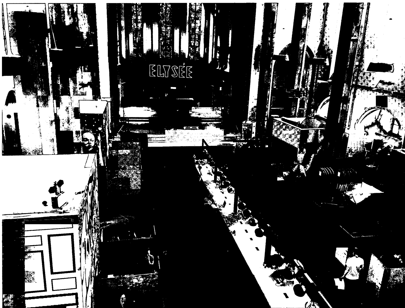
2 Ehemalige Pfarrkirche St. Elisabeth Aachen (1907–2010), jetzt „Digital Church“.