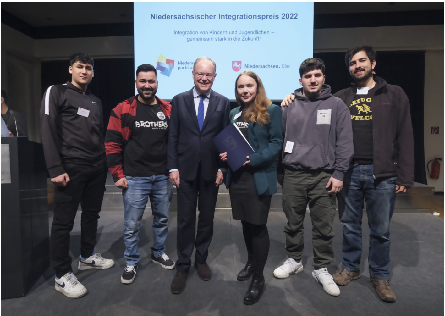
Ministerpräsident Stephan Weil (NI) würdigte die Arbeit der BROTHERS mit dem Niedersächsischen Integrationspreis 2022

Landkreis Göttingen gefördert, allerdings – wie so häufig – als Pilotprojekt, das demnächst ausläuft. Da die ersten Zwischenergebnisse der Evaluation sehr vielversprechend sind, ist dringend eine Verstärkung des Projektes geboten. So zeigen sich Einstellungsveränderungen in Bezug auf die zentralen Projektthemen wie Gleichberechtigung und Chancengleichheit, Ehre und Ehrkultur, Akzeptanz von unterschiedlichen Lebensweisen. Beispielsweise werden Homosexualität akzeptiert und gleiche Rechte für Männer und Frauen vertreten. Lernprozesse sind feststellbar in Bezug auf Gewalt und rhetorischer Kompetenzen: Diskussion und Reflexion wird in Alltagskonflikten genutzt, anstelle der Anwendung körperlicher Gewalt.