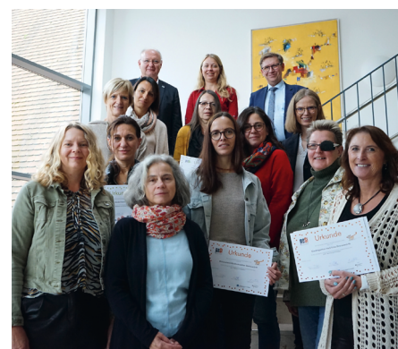
Preisverleihung ReSi+ mit dem Landrat des Landkreises Donau-Ries

Nach unseren Informationen werden im Jahr 2023 keine Fördergelder bereitgestellt, so dass das KfW-Förderprogramm 455-E nicht wieder aktiviert werden kann. Für das Jahr 2024 werden wir unsere Bemühungen nicht ruhen lassen