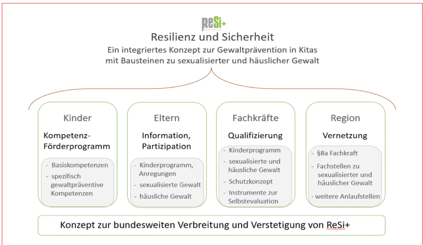
Abbildung 1: Das Präventionskonzept ReSi+

zu erzählen, spielt vor dem Hintergrund von Disclosure-Prozessen eine gewichtige Rolle. Eltern werden z.B. durch Elternbriefe in der Kindertageseinrichtung Informationen zum Kinderprogramm zur Verfügung gestellt, so dass sie in die kindlichen Lernprozesse einbezogen werden. Darüber hinaus erhalten sie Informationen zu Kinderschutz und Gewaltprävention sowie über regionale und überregionale Hilfsangebote. Die pädagogischen Fachkräfte werden durch zertifizierte ReSi+-Fortbildungsleitungen in der Durchführung des Programms geschult und können das Programm in ihrer Einrichtung durchführen. Durch die enge Verschränkung mit Bildungszielen in dieser Altersgruppe lässt sich das Programm gut in den Alltag in Kindertageseinrichtungen integrieren. Die Materialien wurden in einem partizipativen Weiterentwicklungsprozess in der Praxis erprobt und modifiziert.