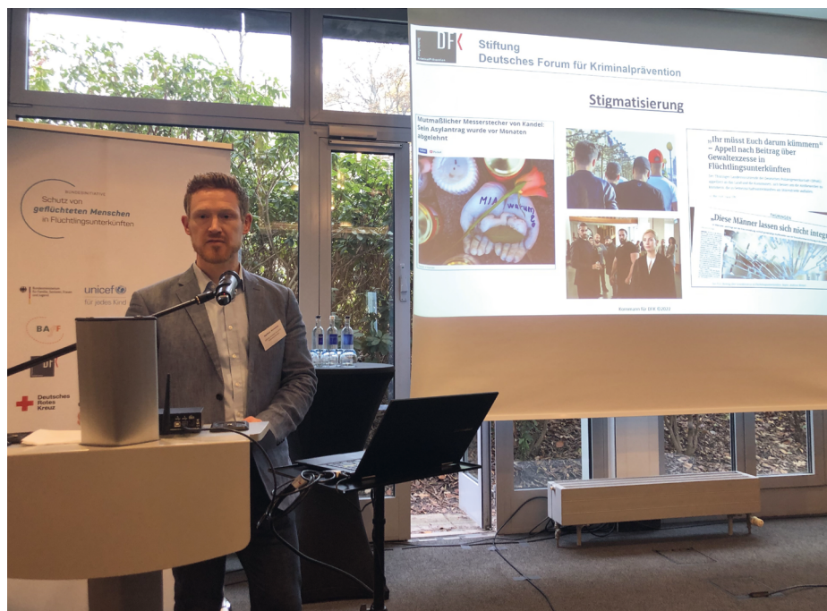
Fachimpuls des DFK im Rahmen des Fachtags „Gewalt in Gemeinschaftsunterkünften für Geflüchtete begegnen“ am 18.11.2022 in Potsdam

Im Rahmen des Flüchtlingsgipfels im Oktober 2022 wurde seitens des Bundes weitere Unterstützung zur Bewältigung der hohen Flüchtlingszahlen in Form von finanziellen Mitteln und Immobilien in Aussicht gestellt. Die Sicherheit im Kontext von Zuwanderung bleibt dennoch eine gesamtgesellschaftliche Aufgabe. Gerade in Krisenzeiten mit hohem Handlungsdruck sollten die bestehenden „Mindeststandards zum Schutz von geflüchteten Menschen in Flüchtlingsunterkünften“ auch weiterhin Beachtung finden. Es gilt, einen sensiblen Blick nicht nur auf öffentlichkeits-