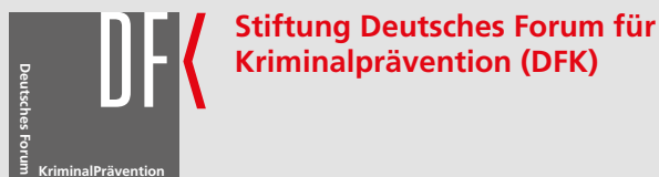
Abbildung 2 Seite 6: © TH Nürnberg

Die Stiftung Deutsches Forum für Kriminalprävention fördert als unabhängige Einrichtung die gesamtgesellschaftliche Kriminalprävention in Deutschland. Dazu wurde das DFK im Jahre 2001 gemeinsam von Bund und Ländern als gemeinnützige Stiftung gegründet, deren breitgefächertes Kuratorium alle relevanten gesellschaftlichen Kräfte zu gemeinsamer Verantwortung zusammenführt.