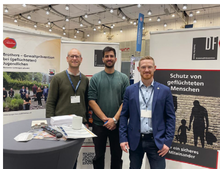
Stand des DFK anl. des DPT 2022 in Hannover. Die Projektsprechstunde mit einem der Teamleiter im Projekt BROTHERS (Mitte) fand hohen Zuspruch.

Im Themenfeld „Staatliche Förderung des Einbaus von Sicherheitstechnik“ sah es im zurückliegenden Jahr nicht ganz so positiv aus. Nachdem in den letzten Jahren die Fallzahlen stetig gesunken waren, wurde auch die Förderung des Bundes auf 32 Mio. Euro eingeschränkt, so dass die in 2022 gekürzten Finanzen im Juni schon aufgebraucht waren. Förderanträge können seit Juli 2022 nicht mehr gestellt werden. Obwohl das DFK gemeinsam mit dem Bundesministerium für Wohnen, Stadtentwicklung und Bauwesen (BMWSB) und der Kreditanstalt für Wiederaufbau (KfW) die Programme fortentwickelt hat, können diese Weiterentwicklungen derzeit aufgrund fehlender Finanzmittel nicht umgesetzt werden.