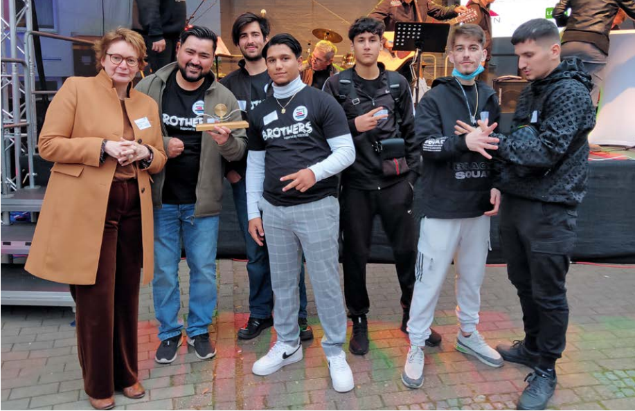
Auch die Niedersächsische Ministerin für Soziales, Gesundheit und Gleichstellung, Daniela Behrens, interessierte sich für die „BROTHERS“

Flucht ist jung und männlich. Die bundesweite Präventionslandschaft ist jedoch kaum auf die spezifischen Bedarfe von jungen geflüchteten Männern ausgerichtet. Das DFK fördert daher eine nachhaltige Evaluation des Projekts „BROTHERS – Gewaltprävention bei (geflüchteten) Jugendlichen supported by HEROES“.