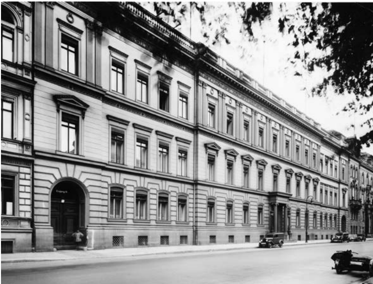
Reichsministerium der Justiz ab 1937 in der Wilhelmstraße 65.

Ab 1934 wurde die Justiz in ganz Deutschland zentralisiert. Die Gerichte wurden nicht mehr von den Ländern, sondern vom Reich verwaltet. Das preußische Justizministerium verschmolz mit dem Reichsressort zum „Reichs- und preußischen Justizministerium“. Dadurch wuchs das Personal des Ministeriums auf etwa 250 Mitarbeiter an. 1937 verlegte das Ministerium seinen Sitz aus der Voßstraße in die Wilhelmstraße 65, das ehemalige preußische Justizministerium. Frauen gab es im