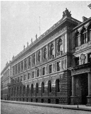
Das Reichsamt der Justiz hatte seinen Sitz in der Voßstraße 4 in Berlin.

Das Deutsche Reich wurde politisch dominiert von Preußen, das rund zwei Drittel der Fläche und Einwohner des gesamten Reiches ausmachte. Das Reichsjustizamt war wesentlich kleiner als das preußische Justizministerium, noch in der Weimarer Republik hatte das preußische Ministerium fast dreimal so viele Mitarbeiter wie das Reichsressort. Wegen der größeren Ressourcen und der politischen Vormachtstellung