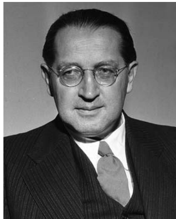
Thomas Dehler (FDP) wurde 1949 der erste Bundesjustizminister.

Seinen Sitz hatte das Ministerium ab 1950 in der Rosenberg, einer neo-romantischen Villa im Bonner Stadtteil Kessenich. Der Neustart des Ministeriums erfolgte allerdings mit viel altem Personal. Eine unabhängige wissenschaftliche Kommission („Rosenburg-Projekt“) hat 2016 dargelegt, dass viele Juristen, die schon während der Nazi-Zeit tätig waren, wieder im Bundesjustizministerium eingestellt wurden. 1957 waren gar 77 % aller Leitungspositionen des Ministeriums mit ehemaligen NSDAP-Mitgliedern besetzt. Man glaubte auf