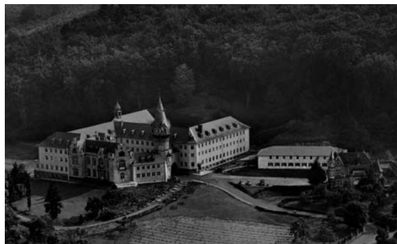
Die Rosenburg, eine Villa in Bonn-Kessenich, war ab 1950 Sitz des Ministeriums.

Den gesellschaftlichen Aufbruch der 1960er Jahre, das Verlangen nach mehr Selbstbestimmung und einer kritischen Auseinandersetzung mit der Nazi-Vergangenheit spiegelte die Rechtspolitik lange Zeit kaum wider: 1965 trat Bundesjustizminister Ewald Bucher (FDP) aus Protest gegen die Verlängerung der Verjährungsfristen und die weitere Verfolgbarkeit von Nazi-Verbrechern zurück. Sein Nachfolger Richard Jaeger (CSU) sorgte für