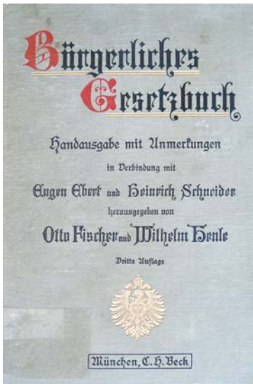
Das Bürgerliche Gesetzbuch (BGB) trat am 1. Januar 1900 in Kraft und gilt mit zahlreichen Änderungen bis heute.

Das Reichsjustizamt hatte für die Defizite des BGB wenig Gespür und dies war auch eine Folge der diskriminierenden Personalauswahl: Frauen waren bis 1922 vom Justizdienst komplett ausgeschlossen. Juden konnten nur dann eine Karriere im Staatsdienst machen, wenn sie ihrem Glauben abschworen und zum Protestantismus konvertierten. Für kluge Köpfe aus den unteren sozialen Schichten war eine juristische Ausbildung finanziell unerschwinglich, schließlich mussten Referendare und Assessoren viele Jahre unentgeltlich arbeiten, bevor sie eine bezahlte Anstellung erhielten. Die Mitarbeiter des Reichsjustizamtes verband daher nicht nur ihr hohes juristisches Können, sie hatten durchweg eine