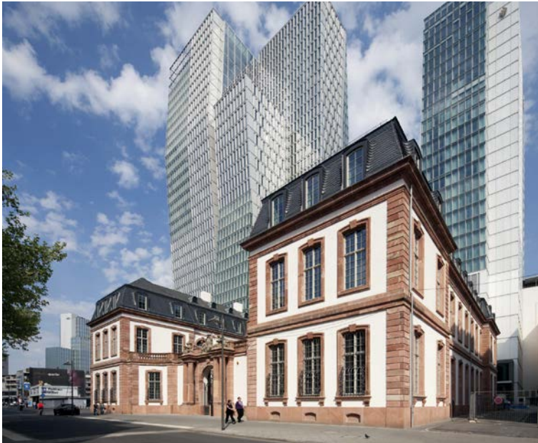
Das erste Reichsjustizministerium hatte 1848 seinen Sitz in Frankfurt am Main im Palais Thurn und Taxis. Das Gebäude wurde 2009 rekonstruiert.

Während die Nationalversammlung an einer Verfassung mit Grundrechten arbeitete, begann das Justizministerium damit, die Rechtszersplitterung zwischen den deutschen Einzelstaaten, die vor allem den Handel erschwerte, zu beseitigen. Das Ministerium entwarf eine einheitliche Wechselordnung und legte den Entwurf eines Allgemeinen Deutschen Handelsgesetzbuches vor. Ein sichtbares Erbe dieser Zeit ist auch das heutige