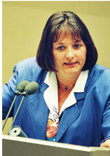
Sabine Leutheusser-Schnarrenberger (FDP) war 1992 als erste Frau Bundesjustizministerin.

Die christlich-liberale Koalition ab 1982 setzte manche Akzente der Rechtspolitik anders als ihre Vorgänger. Eine „Reliberalisierung des Zivilrechts“ führte etwa dazu, dass das soziale Mietrecht zu Gunsten der Vermieter modifiziert wurde. Umstritten waren auch Verschärfungen des Demonstrationsstrafrechts. Die Stärkung des Opferschutzes im Strafverfahren stieß hingegen auf breite Zustimmung.