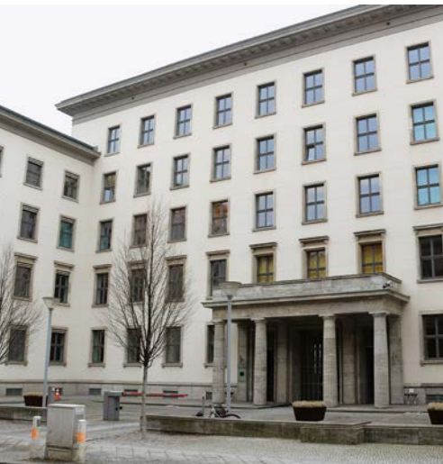
Das Ministerium der Justiz der DDR hatte seinen Sitz in der Clara-Zetkin-Straße in Berlin-Mitte. Heute heißt die Straße Dorotheenstraße und das Gebäude wird von der Verwaltung des Deutschen Bundestages genutzt.

Bei allen Aktivitäten unterlag das Ministerium der politischen Kontrolle und Steuerung durch die Staatspartei SED. Die Partei prägte die Gesetzgebung und entschied