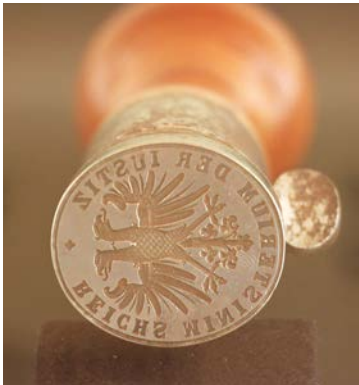
Das Siegel des ersten „Reichsministerium der Justiz“ aus dem Jahr 1848.

Während in Frankfurt am Aufbau eines deutschen Nationalstaates gearbeitet wurde, hatten in den deutschen Einzelstaaten die konservativen Kräfte – Fürstentümer, Militär und Bürokratie – ihre alte Macht schnell wiedererlangt. Allen voran der preußische König lehnte die Verfassung der Nationalversammlung ab und löste das Parlament schließlich mit Gewalt auf. So scheiterte 1849 der Versuch, einen deutschen Nationalstaat auf demokratischer Grundlage zu schaffen. Es setzte eine neue Phase der Unterdrückung und der politischen Verfolgung ein. Am 20. Dezember 1849 endete die Existenz des ersten Reichsministeriums der Justiz.