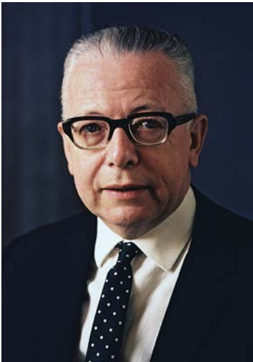
Bundesjustizminister Gustav Heinemann (SPD) modernisierte das Recht ab 1966.

In der Amtszeit von Bundesjustizminister Gustav Heinemann (SPD) wurden überholte Straftatbestände wie die „Kuppelei“ gestrichen und Homosexualität zwischen erwachsenen Männern entkriminalisiert. Auch die Diskriminierung der nicht-ehelichen Kinder wurde beseitigt, bis dahin galten nicht-eheliche Kinder als nicht ver-