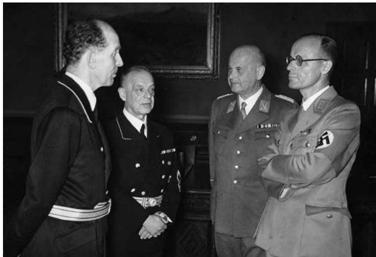
„Herrenmenschen“ und Unrechts-Juristen (v. l. n. r.): Roland Freisler (Präsident des Volksgerichtshofes), Franz Schlegelberger (Staatssekretär des Reichsjustizministeriums), Otto Thierack (Reichsjustizminister), Curt Rothenberger (Staatssekretär des Reichsjustizministeriums).