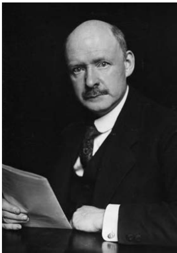
Der Rechtsphilosoph und Strafrechtsprofessor Gustav Radbruch (1878–1949) war der bedeutendste Reichsjustizminister der Weimarer Republik.

In den 14 Jahren der Weimarer Republik waren 19 verschiedene Justizminister im Amt; der bedeutendste von ihnen war der Rechtsphilosoph und Strafrechtsprofessor Gustav Radbruch (SPD). Während seiner Amtszeit wurde das erste Jugendgerichtsgesetz (JGG) vorgelegt.