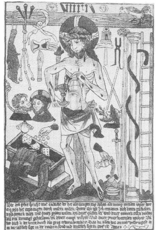
Der von zahlreichen "Arma Christi" umgebene Schmerzensmann; in der Bildmitte links Judas und Jesus (darüber ein Beschneidungsmesser), rechts ein speiender Judenkopf (Ablaßbrief, um 1430).

ein Motiv für den Mord an: Die Juden wollten in den Besitz des Blutes gelangen, weil sie sich davon Heilung versprachen. Wie die Kolmarer Chronik vermeldet, nahm der König den Pogrom jedoch nicht widerspruchslos hin, sondern erlegte der Stadt vielmehr eine Geldstrafe auf und wies den Erzbischof von Mainz an zu predigen, die Christen hätten den Juden überaus großes Unrecht zugefügt. Wemer, für dessen Tod man gemeinhin die Juden verantwortlich mache, ja, der von gewissen einfältigen Christen sogar als Heiliger verehrt werde, verdiene verbrannt und seine Asche in alle Winde verstreut zu werden. All dies konnte dem Andrang der Pilger keinen Abbruch tun, so daß bereits 1289 die Kapelle im nahegelegenen Bacharach, in die man die Leiche des Jungen überführt hatte, vergrößert werden mußte.