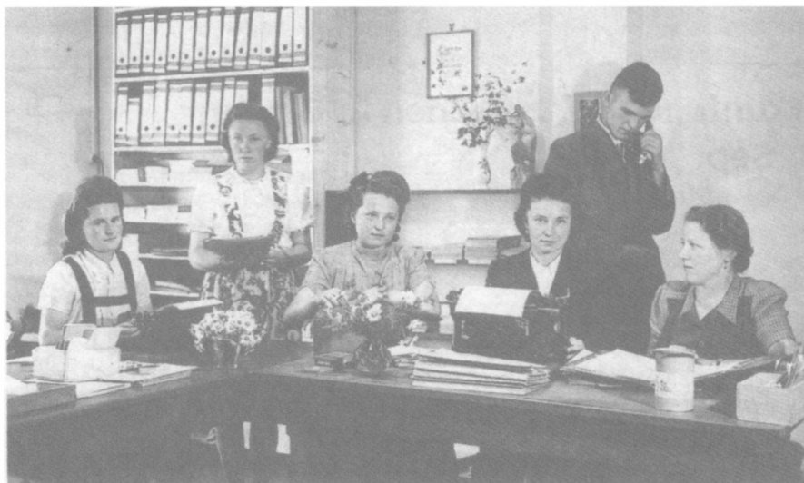
Mitarbeiterinnen und Mitarbeiter der Caritas-Suchstelle Waldsassen am Arbeitsplatz.