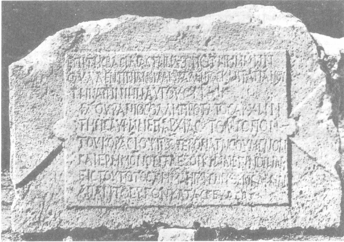
Abbildung 2: Die mittlerweile verschollene Inschrift aus Korasion

In der Zeit der Kaiser Valentinian, Valens und Gratian – also zwischen 367 und 375 – hat Flavius Uranius, Statthalter der Provinz Isauria , nach eigenen Plänen einen Ort Korasion gegründet; und zwar an einer Stelle, die vorher unbekannt und wüst war. Durch diese Inschrift ist also klar, dass das im 19. Jahrhundert noch reiche Ruinenfeld 46 zwischen Seleukeia am Kalykadnos und Korykos Korasion ist. Heute allerdings sind dort nur noch sehr spärliche Reste zu finden.