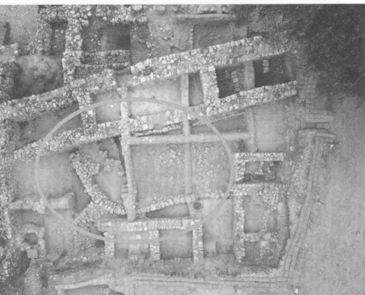
4. Die Kasemattenmauer („Salomonische Mauer“, Mitte 10. Jh. vC) kreuzt eine rundgeführte Mauerstruktur, die älter ist. Noch gibt es keine Erklärung für diese Bauphase.