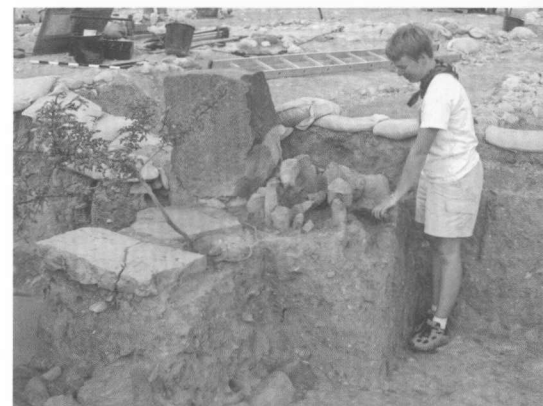
3. Kultstätte in Area A, Oberstadt, Nähe des Zeremonialpalasts, die sekundär in die Ruinen eingebaut wurde.

legt wurde, ist eine hochwertige Unter-teil-Darstellung einer lebensgroßen hockenden Person (Abb. 2). Anhand der auf dem Sockel erhaltenen hieroglyphischen Inschriften kann sie als Darstellung von Nebi Pu identifiziert werden, einem Hohepriester im Tempel des Gottes Ptah in Memphis während der Herrschaft von Pharaon Amenemhat III. in der 12. ägyptischen Dynastie.