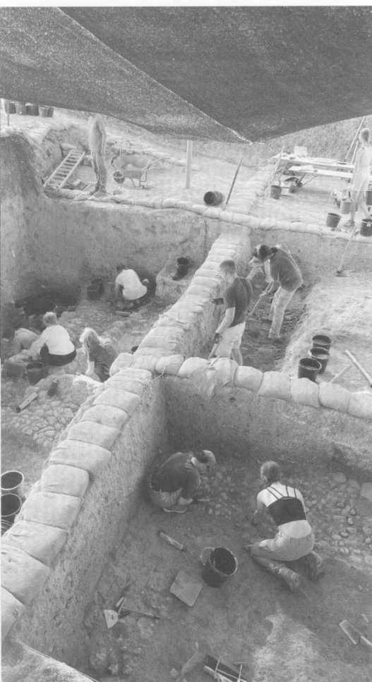
5. Blick in Area „T“: in der Bildmitte legen die Volontäre gerade weitere Teile der massiven Mauern frei.

tament. Und ja, Hazor wird in der Bibel erwähnt, jedoch ringen Forschende hier ebenso mit der Datierung dieser Traditionen – genau das macht die Frage nach der Bedeutung Hazors zu biblischer Zeit allerdings so spannend. Generell gilt, dass wohl kaum größere schriftliche Quellen in der Bibel existieren, die vor das 8. Jh. vC datieren. Das hat mit der Schriftfähigkeit der damaligen Gesellschaft zu tun, die wir aus den bis dahin nur sehr sporadischen epigrafischen (inschriftlichen) Befunden ableiten können. Vielleicht mögen auch einige mündliche Überlieferungen aus älterer Zeit bewahrt sein?