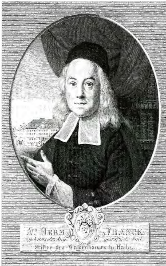
August Hermann Francke (1663–1727)

1694 offiziell gegründeten Universität Halle und der für Kirche und Schule praxisorientierten Ausbildung der Studenten fanden der preußische Staat und der hallische Pietismus zur Symbiose von „Preußentum und Pietismus“ zusammen: die Berliner Regierung, weil sie im noch „absolutismusfreien“ Raum hilfreiche Instrumente ihrer politischen Ziele förderte, und der hallische Pietismus, weil er die staatliche Protektion als vermeintliche Unterstützung seiner eigenen Ziele verstand. 94 1698 begann der Bau des weithin Aufsehen erregenden Waisenhauses auf dem repräsentativsten Grundstück der Stadt Glaucha, das Francke mit massiver Unterstützung aus Berlin hatte gewinnen können. 95 Im selben Jahr wurden ihm Privilegien gewährt, die seine Anstalten als „Annexum“ der Universität städtischer und ständischer Jurisdiktion entzogen und die Gründung eigener Wirtschaftsbetriebe zur Finanzierung der Unternehmungen erlaubten.