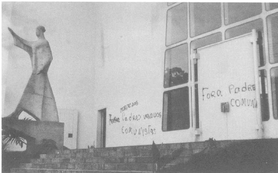
Dominikanerkirche São Paulo Ende 1960er Jahre

Am 4. November 1969 wurde Frei Tito zusammen mit sechs anderen Dominikanern festgenommen. Vorgeworfen wurden ihnen subversive und terroristische Aktivitäten, v. a. die Unterstützung der Guerillabewe-