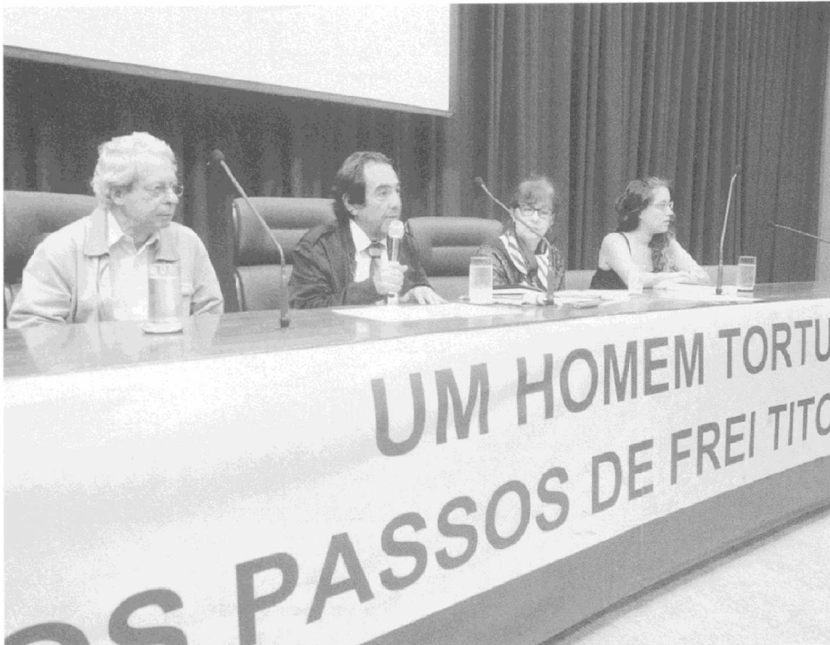
Buchvorstellung (links Frei Betto)

„Im Zustand, in welchem ich mich befand, hatte ich nicht mehr genügend Kräfte, um noch weitere Leiden zu ertragen. Es blieb mir nur eine Lösung: mir den Tod zu geben. ... Ich verlor die Besinnung, eingehüllt von Schmerzen und Glauben.“