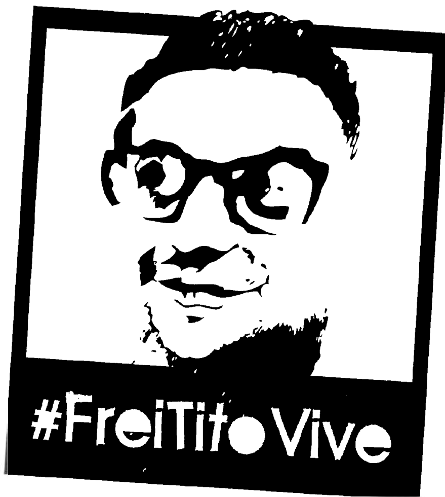
Logo „Frei Tito lebt“

ist es – weil es Schrei und Empörung ist – ganz begierig auf Hoffnung.“