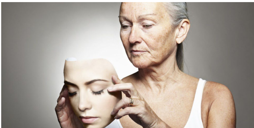
Abb. 2: GarmaOnHealth. 34