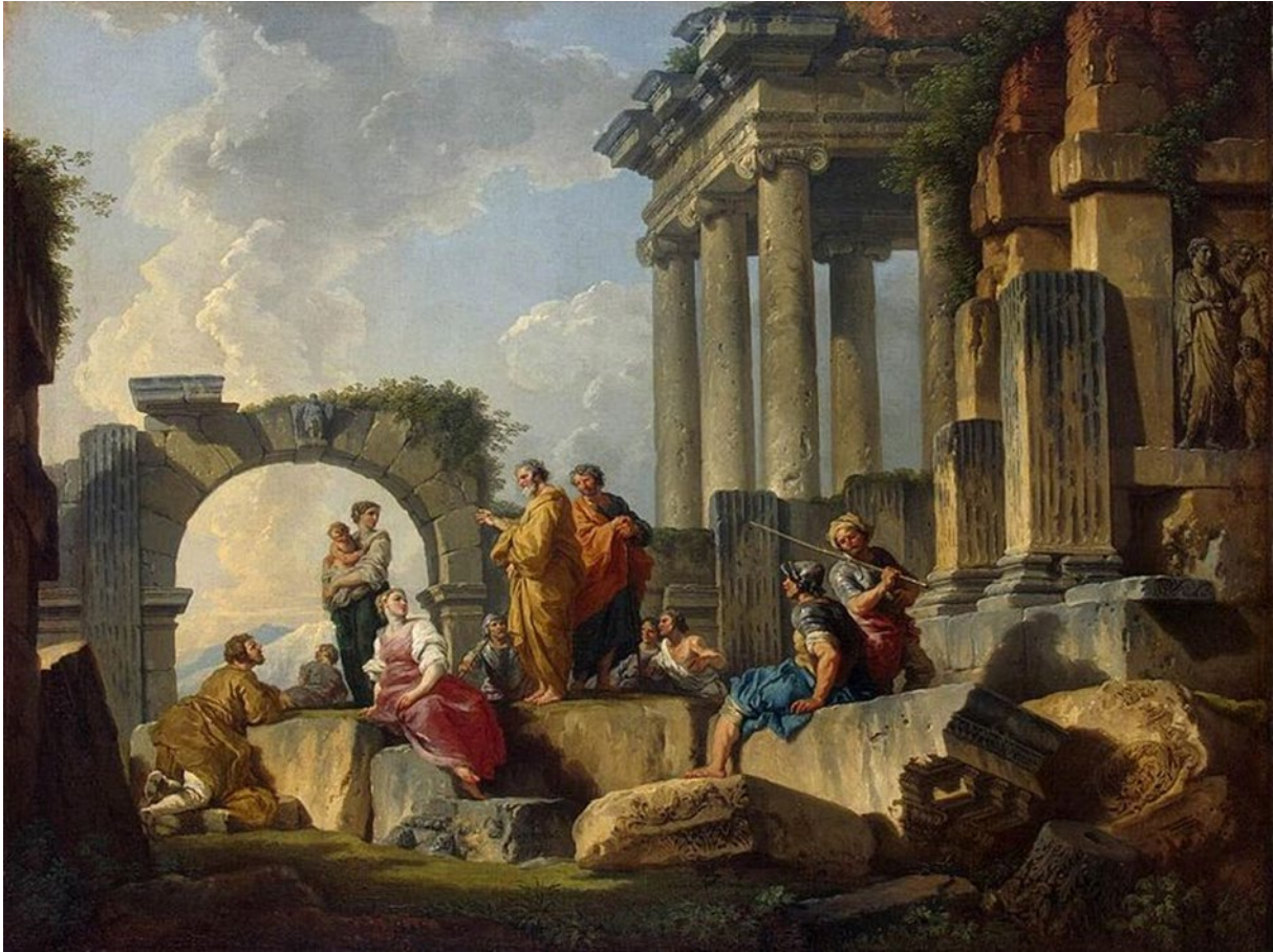
Abb. 3: Giovanni Paolo Panini (1691/92-1765), „L'apostolo Paolo predica sulle rovine“, 1744. 38

1691 oder 1692 wurde der italienische Architekt und Landschaftsmaler Giovanni Paolo Panini in Piacenza geboren. 1765 starb er in Rom. 39 1744 vollendete er ein Bild, das ich Ihnen mitgebracht habe. Es ist 64 x 84 cm groß und hängt heute in der Eremitage zu St. Petersburg.