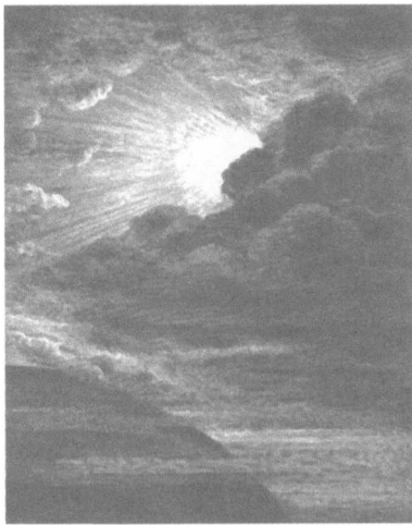
Abb. 1: G. Doré, Es werde Licht!, Gen 1,3, 1866.

das Bildmaterial folgerichtig vielfältig angelegt. 4 So bebildert die „Y-Bibel“ etwa das Buch Genesis 5 mit einem Bild aus der 1866 erschienenen Bilderbibel des französischen Illustrators Gustave Doré.