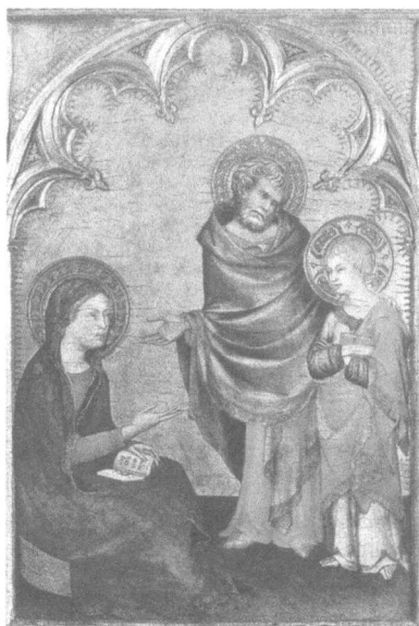
Abb. 2: S. Martini, Heilige Familie, 1342.

Im Bereich der Familienbibeln fallen zwei Werke ins Auge, die biblische Geschichten mit Werken aus der Kunstgeschichte verbinden. Beiden Bibeln ist gemeinsam, dass sie als ‚Hausbibeln‘ für die ganze Familie, generationsübergreifend, also auch für Jugendliche, konzipiert wurden und dass die Kunstwerke von einer katholischen Expertin kommentiert werden.