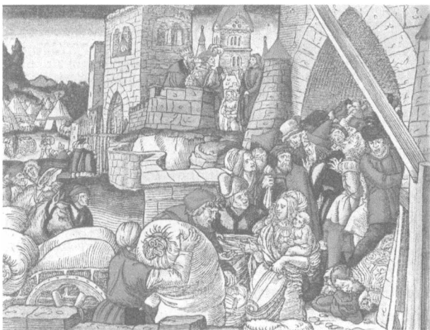
Abb. 3: Das Ende der Hungersnot in Samarien, 1534, Lutherbibel.

lie mit Bildern der Kunst“ zu den fünf Büchern Mose heraus 10 . 2017 folgte die Herausgabe der „Geschichten von Königen, Richtern und Propheten“ 11 . Das Alleinstellungsmerkmal dieser Familienbibel ist die gleichzeitige Reise durch Bibeltext und bildende Kunst. Anders als bei Oberthür/Burricher ist hier jede Erzählung mit einem Bild verknüpft. In ausgezeichneter Bildqualität und -größe lädt Lier hier dazu ein, gemeinsam biblische Kunst detailliert(er) wahrzunehmen. Lier gibt Informationen zum zeithistorischen Entstehungskontext, zu religiösen und biographischen Hintergründen von Malern 12 und regt zum Selbst-Kreativ-Werden an 13 . Lier stellt zudem anthropologische und existentielle Fragen, die Jugendliche ansprechen.