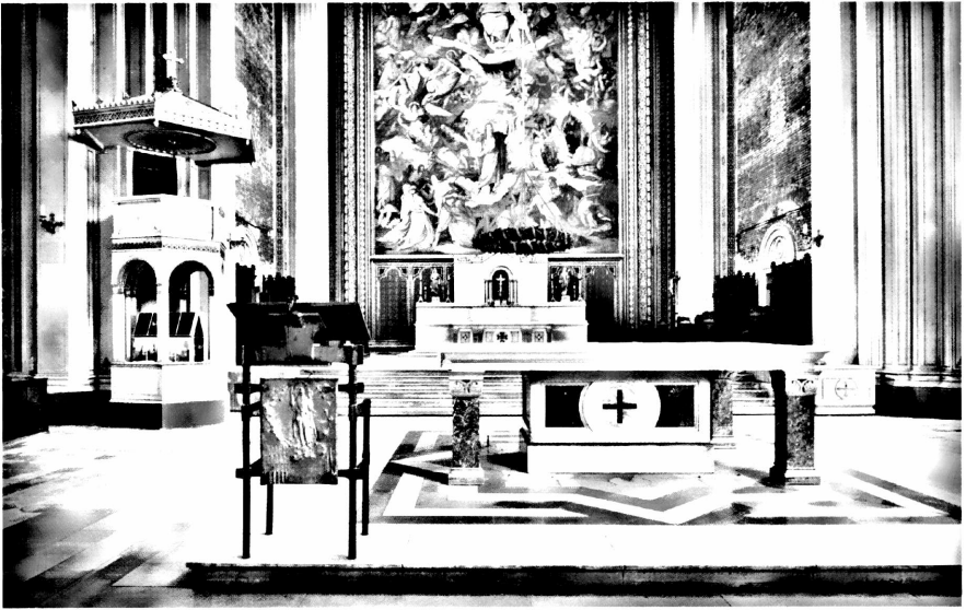
ST. LUDWIG, PRESBYTERIUM UND CHOR

Orte, an denen und von denen aus verkündigt wird, ist damit ein hoher theologischer Anspruch verbunden: Sie sollen Zeichen sein, dass es hier nicht allein um zwischenmenschliche Kommunikation geht, sondern um jene Rede, in der Gottes Wort selbst zur Sprache gebracht und sein Heilshandeln gegenwärtig wird. Je mehr dies an den Orten und ihrer Ausgestaltung deutlich wird, umso selbstverständlicher sollte sein, dass diese Orte auch jener Verkündigung vorbehalten bleiben, die Gottes Heilshandeln anamnetisch vergegenwärtigt.