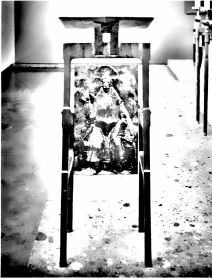
AMBO MIT PANTOKRATOR IN DER COENA-DOMINI-KIRCHE IM HERZOGLICHEN GEORGIANUM

Ambo aus halten: „Sie ist eben ‚Präsidialhomilie‘, weil sie der Dienst des Vorstehers ist. Das Amt verleiht ihr die Bedeutung. Christus ist im Prediger präsent und damit in der Predigt.“ 22