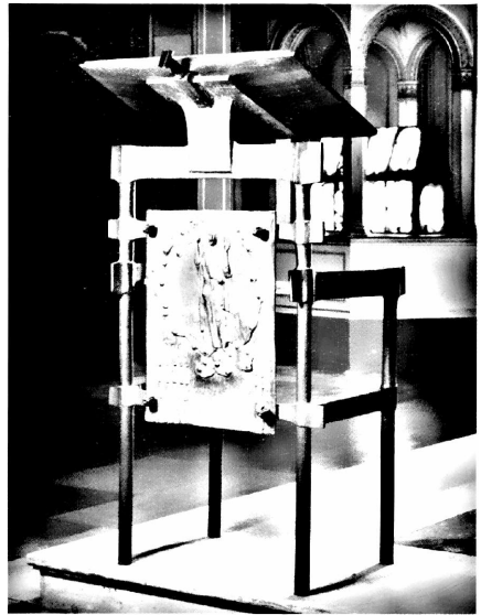
ST. LUDWIG, AMBO

und den Gläubigen bewußt machen kann, daß in der Messe der Tisch sowohl des Wortes [Gottes] wie des Leibes Christi bereitet wird. Dieser Ort muß erhöht, feststehend und würdig sein und ganz seinem Zweck entsprechen. Insbesondere muß er der Gemeinde das aufmerksame Hören im Wortgottesdienst leicht machen. Daher soll für jede Kirche eine Lösung gefunden werden, bei der Ambo und Altar einander entsprechen und in richtiger Beziehung zueinander stehen.“ 11