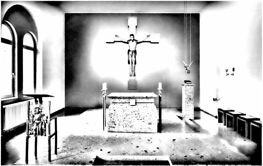
ALTARRAUM DER COENA DOMINI-KIRCHE IM HERZOGLICHEN GEORGIANUM