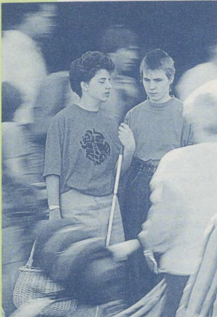
Jeder kann zum Anwalt werden – auch mitten auf der Straße

Hilfe und Anwaltschaft Angewiesenen stärker zu lenken und zu vertreten, als es von deren Zustand her erforderlich ist. Auf allen Feldern sozialen Tuns – sei es Erziehung, Schule, Sozialarbeit, Psychiatrie, Altenbetreuung oder anderes – zeigt sich denn auch, dass gut gemeintes Helfen in der Gefahr steht, zu bevormunden. Die Gründe können genauso in Routine liegen wie im Wunsch, Abläufe rationeller zu organisieren, oder sogar im Ausüben von Macht. Der Tendenz zu solcher systemimmanenter Bevormundung können nur institutionalisierte Gelegenheiten zum Perspektivenwechsel (Rollenspiele im Rahmen von Fortbildung, Supervision, regelmäßige Anhörungen und Gespräche) und die konsequente Ausrichtung aller anwaltschaftlichen Tätigkeiten auf das Ziel maximaler Autonomie vorbeugen. Anwaltschaftlichkeit steht unter dem Vorbehalt, sich selbst überflüssig machen zu sollen.