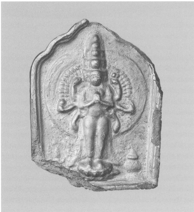
Abb. 27 | Tzatta mit Darstellung des Bodhisattva Avalokiteśvara in seiner elfköpfigen und tausendarmigen Erscheinungsform, Tibet, Ton. Tzattas werden in Tempeln und an heiligen Orten aufgestellt. Detmold, Lippisches Landesmuseum, Inv.-Nr. V0593

Hier liegt ein weiterer Grund für das Hervorrufen des Mitgefühls gegenüber den fühlenden Wesen darin, dass die Buddhas der Vergangenheit in ihrem absoluten Mitgefühl, das sie selbst ganz waren, alle Wesen einschlossen und dass die Verehrung des Buddha heute dadurch geschieht, dass man sich in selbstlosem Mitgefühl dem Anderen widmet. Bei aller strukturellen Unterschiedlichkeit weist die Darstellung Śāntidevas doch interessante Ähnlichkeiten zur christlichen Caritasidee auf, die eben in vielen Auffassungsformen auch davon ausgeht, dass die Liebe zu Christus und zu Gott selbst in der Welt nur in der Form möglich ist, dass man sich seinem Mitmenschen in selbstloser Liebe widmet und somit die Liebe, die von Gott an jeden Menschen ergeht, in der Welt präsent werden lässt.