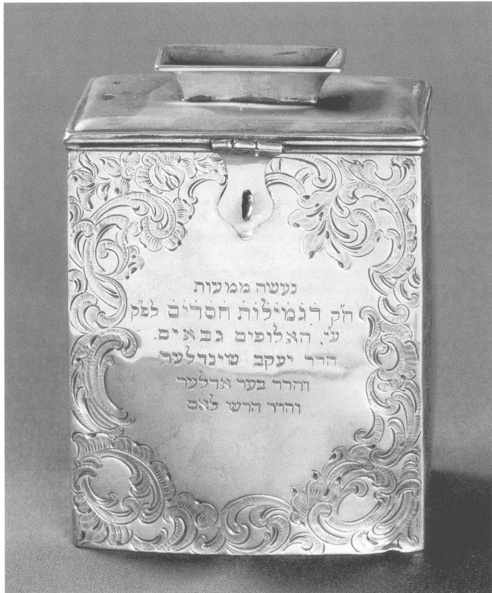
Abb. 24 | Sammelbüchse einer jüdischen Beerdigungsgesellschaft für soziale Wohltätigkeit

Ein weiterer umstrittener Punkt war die Frage, wer unter dem „Nächsten“ zu verstehen sei. Das Familienmitglied, der Stammesgenosse, der anonyme Mitbürger oder die nichtjüdischen Menschen „der ganzen Welt“? Bei Lebensgefahr stellte sich diese Frage natürlich nicht. Geriet ein nichtjüdischer Fremder in Todesgefahr, galt er als Nächster und man musste ihn retten. Der Talmud unterstreicht ausdrücklich, dass das Gebot, Leben zu retten, selbst den Schabbat verdrängt (Bab. Talmud, Joma 84b). Wie aber verhält es sich mit Sozialleistungen? Hatten beispielsweise die Armen „der ganzen Welt“ oder nur die jüdischen Armen ein grundsätzliches Anrecht auf die Ecken der Felder, die Zehnten und andere soziale Unterstützungen?