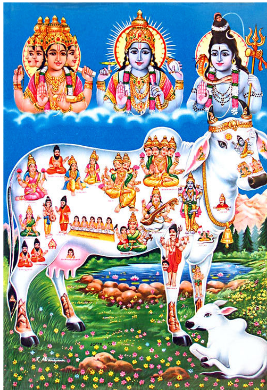
Religiöses Poster von einer Webseite aus dem Umfeld der Hare-Krishna-Bewegung (ISKCON): Kamadhenu – the wish-fulfilling Cow. Um 1912 kursierten vergleichbare Poster ("Die Kuh mit 84 Gottheiten") gehäuft, verbreitet von sogenannten Agorakshanasabh (Vereinigungen zum Schutz der Kühe) und Wanderasketen gerichtet gegen den Rindfleischverzehr durch Muslime während der britischen Herrschaft.