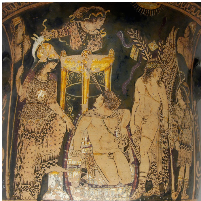
Rotfiguriger, glockenförmiger Krater aus der griechischen Stadt Paestum in Süditalien, 330 v.u.Z. Dargestellt ist Orest in Delphi, flankiert von Athena und Pylades, umgeben von den Erinyen und den Priesterinnen des Orakels, vielleicht inklusive Pythia hinter dem dreibeinigen Kessel. Aufbewahrt seit 1753 im Britischen Museum in London, GR 1917.12-10.1.

Ja, wenn auch um eine äußerst lückenhafte. Im zweiten von vier Teilen meiner Arbeit habe ich der Milch gebenden Muttererdekuh Prthvi zum Kontrast Jesus, den Erlösung, Wein und Blut spendenden Gottmenschen, und die Blut saugenden Erinyen aus der Orestie des Aischylos beigelegt. Das ist so provokant wie ahistorisch. Ich gehe nicht von gemeinsamen historischen oder sprachlichen Ursprüngen, von Archetypen oder von einer Diffusion ihrer nicht sehr ähnlichen Geschichten aus. Und doch hat, gibt oder stiehlt jedes dieser Wesen eine Flüssigkeit, in der noch so viel mehr mit rinnt, strömt oder tröpfelt: Die Liebe der Kuh, der Verstand und die psychische Gesundheit des Orestes, die aufopferungsvolle Liebe Gottes. Das sind weltbewegende Mächte wie das Potential, die ganze Welt zu ernähren oder gar zu erlösen, weltweit eine Kirche zu formen, die ihre Mitglieder durch den metaphorisch oder durch „Transsubstantiation“ in Jesu Blut verwandelten Wein aneinander bindet. Oder auch das Chaos des Blutvergießens innerhalb einer Familie, dessen rächende, ewig weiter wütende Macht sich in den Erinyen manifestiert, die Gift triefen, Blut saugen und älter erscheinen als die meisten Gottheiten der griechischen Mythologie.