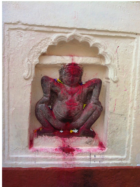
Die Göttin Kamakhya aus Assam, Ostindien, während ihrer Menstruation. Gerrit Lange: "Diese findet einmal im Jahr statt, im Juni, und wird mit dem Festival Ambūbācī Melā gefeiert. Im Inneren des Tempels befindet sich keine Abbildung der Göttin, sondern stattdessen ein Stein in Form einer yoni (Vulva), umspielt von einem natürlichen Bach. Damit ist der Tempel einer der bis zu 64 śakti pīṭhas, „Sitze der Göttin/Kraft“. An diesen Orten sollen sich die Körperteile der Göttin Sati befinden, die nach ihrem Selbstopfer von Śiva und Viṣṇu über den ganzen Subkontinent verteilt wurden."