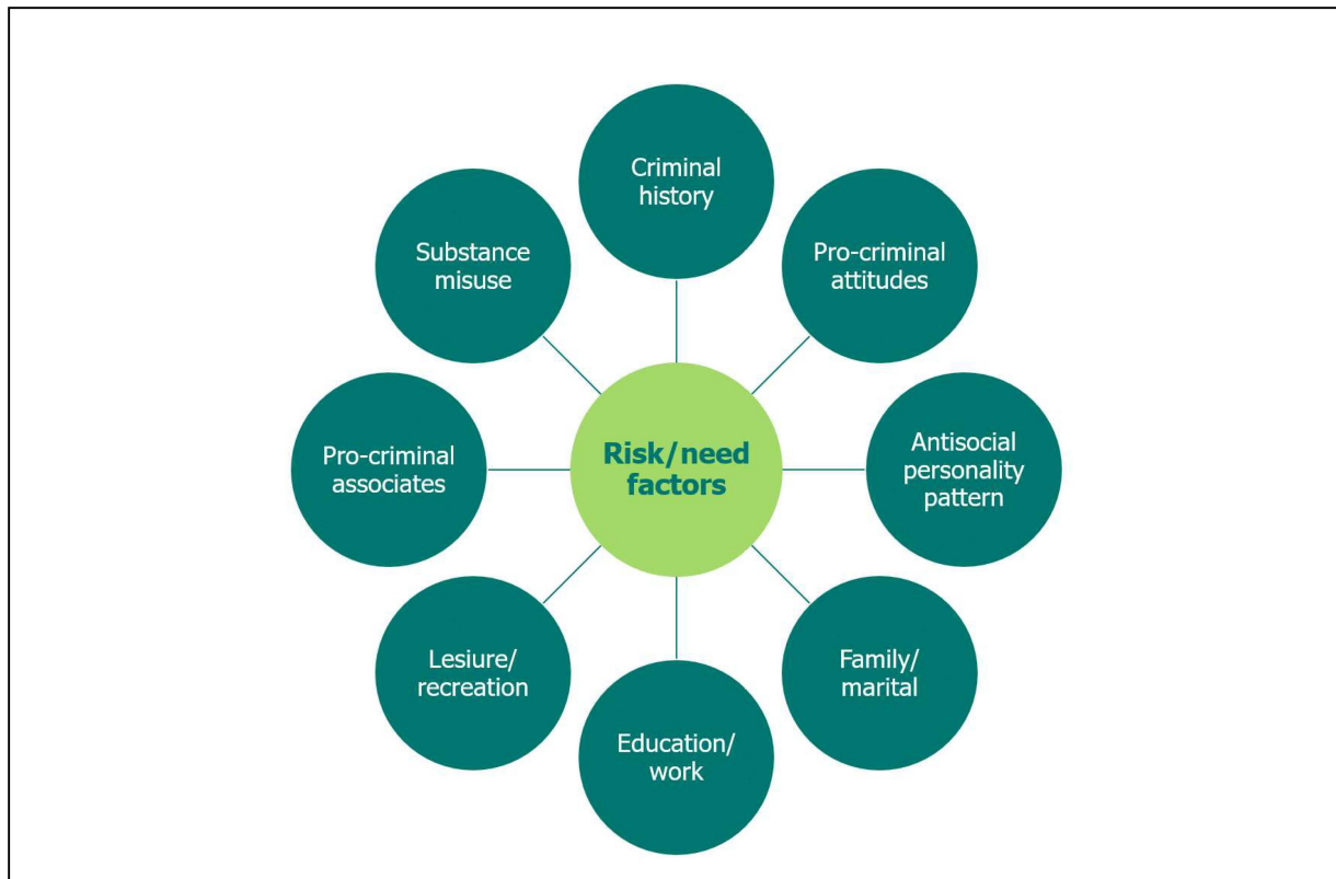
Abbildung 1: Risk Need Responsivity (RNR) Kriminogene Risikofaktoren (Webster 2023)

Beachtung finden. Die Risikobereiche zeigen sich angelehnt an Bonta & Andrews (2024) wie folgt: