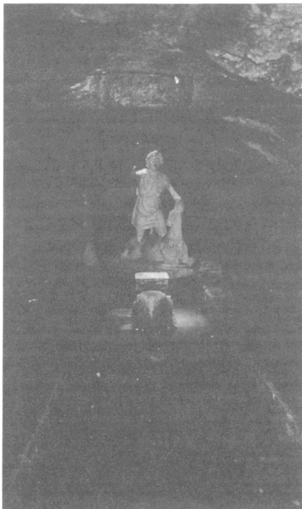
Abb. 3: Mithräum in den Thermen des Mithras, Ostia (Mitte des 2. Jh. n. Chr.): Ansichter der ‚Kulthöhle‘ mit Liegepodien an beiden Seiten; die Kultstatue des stiertötenden Mithras ist aus griechischem Marmor und wurde laut Inschrift von dem attischen Künstler Kriton geschaffen (Κρίτων Ἀθηναῖος ἐποίησεν).

Der abgeschlossene, dunkle Höhlenraum gab Gelegenheit zu besonderen Lichteffekten. Verschiedene Altäre und Reliefs des Mithraskultes konnten von innen beziehungsweise hinten künstlich erleuchtet werden. 41 Bestimmte kleine Lichtöffnungen in der Decke konnten noch spektakulärere Effekte hervorrufen, etwa das Beleuchten besonderer Malereien oder Mosaiken an bestimmten Tagen im Jahr. 42 Die Lichtsymbolik wird durch die ständigen Begleiter des Mithras unterstrichen, die persisch gekleideten Knaben Cautes, mit der Fackel nach oben, und Cautopates, der sie nach