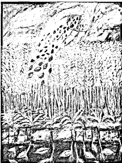
Die Aussaat des Weizens

schuf der Künstler Sieger Köder für den Erstkommunionkurs „Gott lädt uns alle ein“, um Kinder in die bunte Welt des Glaubens und an die Feier der Erstkommunion heranzuführen.