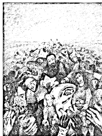
Vom Aufgehen der Saat