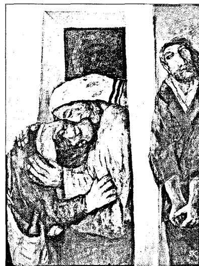
Der barmherzige Vater

Zu einem solchen mystagogischen, erfahrungsgesättigten und spirituellen Zugang zum Geheimnis des christlichen Glaubens gehört nicht zuletzt die Hinführung des