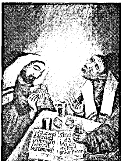
Der Gang nach Emmaus

Kindes zum Gebet. Viele Kinder, die den Weg der Erstkommunionvorbereitung beschreiten, werden zunächst nur sehr wenig bzw. keine Erfahrung mit einer erfüllenden Gebetspraxis besitzen. Deshalb ist es wichtig, ein spirituelles Fundament zu gießen, das tragfähig ist für eine christliche Gebetspraxis. Ein wesentlicher Ansatzpunkt ist die Stärkung der Meditationsfähigkeit der Kinder. Sie beginnt damit, dass Kinder in das Geheimnis der Stille eingeführt werden.