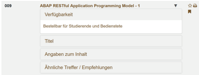
Abbildung 2: Screenshot Verfügbarkeitsanzeige im Katalog plus

Erst nach der Bestellung durch die Nutzerinnen und Nutzer wird das Buch beschafft. Damit keine längeren Wartezeiten entstehen, werden sie in der Regel in einer digitalen Variante beschafft.