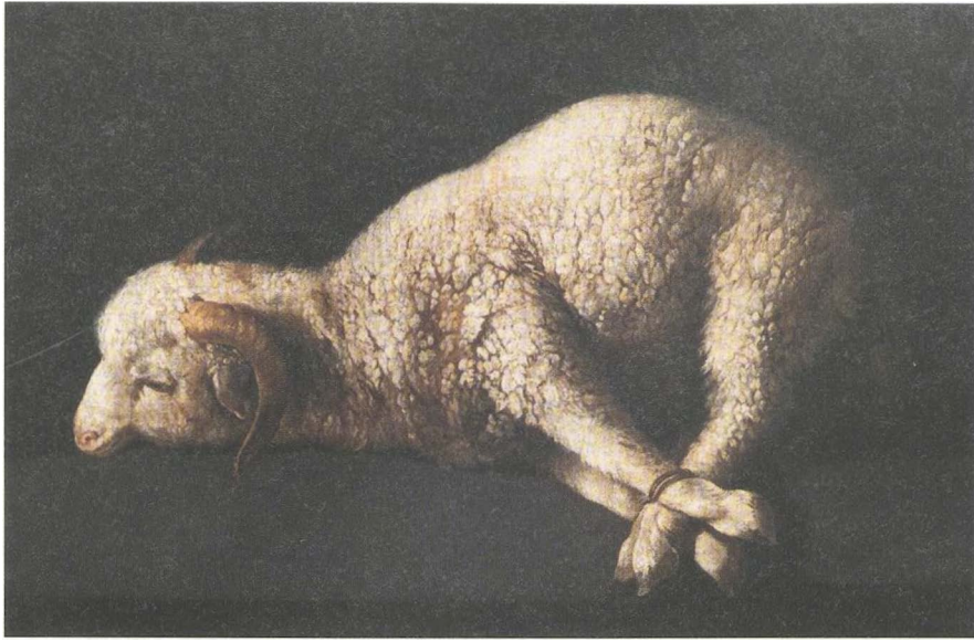
Ungeheuer provozierend ist diese Darstellung des Opferlammes, wie es der spanische Künstler Francisco de Zurbarán im 17. Jahrhundert malte.

Leben davon abhängt, dass der Gottessohn sich mit seinem Leben für ihn einsetzt (Joh 13,33-36).