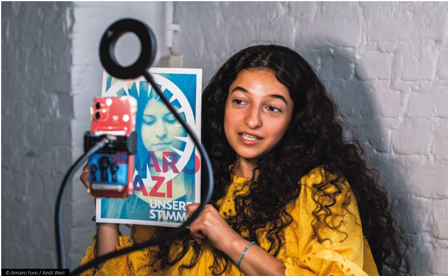
© Amaro Foro / Andi Weil

▲ Gemeinsam entwarfen die Jugendlichen im Workshop Bilder über Community, Empowerment, Aktivismus, Stolz und Identität.