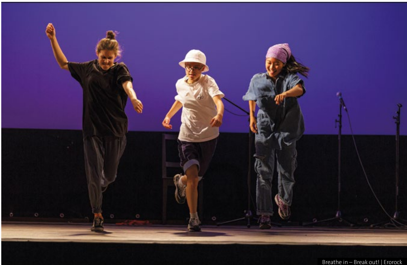
Breathe in – Break out! | Erorock

Bei Projektbeginn im Jahr 2013 waren die sozialen und politischen Problemlagen im Alltag der Teilnehmer:innen, die zwischen 16 und 26 Jahre alt waren, spürbar: Alltagsrassismus, der afrodeutsche Teilnehmer:innen betraf; Verschwörungsideologien im unmittelbaren sozialen und schulischen Umfeld; im Viertel ansässige rechtsextreme Bürgerbrigaden, deren deklariertes Ziel es war, zugezogene Rom:nja und Sinti:zze zu vertreiben; Graffiti-Crews, die großformatig Deutschlandflaggen in ihre Wandbilder einbanden und bei den von uns organisierten Angeboten präsent waren; andere Jugendliche, die im Jugendklub offen mit der Identitären Bewegung sympathisierten; zerrüttete Elternhäuser, die von familiärer Gewalt und Alkoholismus gekennzeichnet waren und sich in Erziehungs- und Bildungsdefiziten manifestierten; unerfüllte psychische und materielle Bedürfnisse; persönliche Angst, Ignoranz und Vorurteile, welche die Teilnehmer:innen davon abhielten, sich selbstständig außerhalb des eigenen vertrauten Stadtviertels zu bewegen. Dennoch zeigte sich schnell, dass alle Teilnehmer:innen trotz ihrer jeweiligen Benachteiligungen und Abwertungserfahrungen insgesamt eine sozial und politisch belastbare