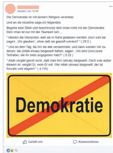
Abbildung 4: Beispiel-Post aus der Broschüre von streetwork@online IS

tionsprojekte beschreiben diese in ihren Publikationen ausführlich. Auf den jeweiligen Webseiten können sie kostenfrei heruntergeladen werden.