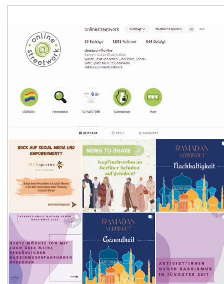
Abbildung 2: Online-Streetwork auf Instagram

streetwork@online . Kontaktaufnahmen mit Jugendlichen und jungen Erwachsenen erfolgen dabei ebenfalls direkt in verschiedenen sozialen Netzwerken. Die aufsuchende Sozialarbeit findet in erster Linie in szenerelevanten Gruppen oder auf entsprechenden Seiten/Profilen statt. Die Online-Streetworkenden können über die Präsenzen von Online-Streetwork und über ihre eigenen Profile angeschrieben werden oder treten proaktiv mit ihrer Zielgruppe in Interaktion.