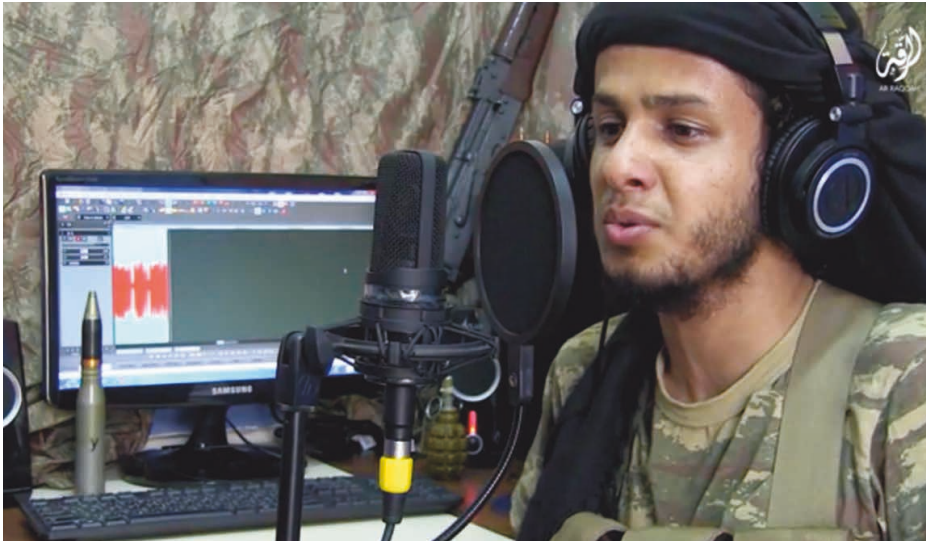
Abbildung 1: Maher Mash'al im Aufnahmebereich (Screenshot aus dem Video „Bal Ahyā' 'inda Rabbihim“, IS-Medienstelle al-Raqa 2016).

in Camouflage-Kleidung mit Munition, einem Gewehr und einer Handgranate vor einem Camouflage-Hintergrund. Diese militärischen Attribute erinnern daran, dass Mash'al stets Sänger und Kämpfer des IS war und dass die Produktion von IS-Anashid vermutlich nicht in Tonstudios, sondern in im Kriegsgebiet errichteten Provisorien stattfand.