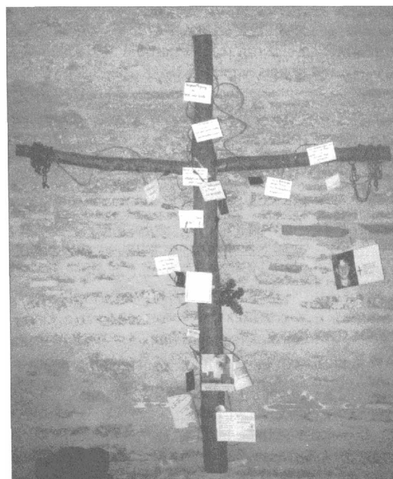
Holzkreuz mit Hinweisen auf Tod, Leid und Unheil in der Welt, St. Ambrosius, Ostbevern

Eine kurze Skizze des Verlaufs der gesamten Unterrichtsreihe soll die zentrale Stellung der Kirchenerkundung verdeutlichen. Als Vorbereitung auf die Kirchenerkundung reflektieren die SchülerInnen zu Beginn der Unterrichtsreihe eigene Ohnmachtserfahrungen angesichts von Krankheit, Tod, Schuld etc. und erkennen, dass der Mensch auch heute noch auf Erlösung angewiesen ist. Nach dieser eher allgemein gehaltenen Einleitung bietet die Kirchenbegehung einen ersten Zugang zum christlichen Erlösungsverständnis. Denn sie bietet zum einen Anknüpfungspunkte an individuelle Erfahrungen von Leid, Unheil und Tod, zum anderen eröffnet sie Perspektiven auf das christliche Erlösungsverständnis. In diesem Sinne stellt die Kirchenraumerkundung eine Gelenkstelle in der Unterrichtsreihe dar. Den SchülerInnen wird dabei das Angebot gemacht, ihre eigenen Erfahrungen im Licht christlich gedeuteter symbolisch-ästhetischer „Sprache“ zu reflektieren und sich zugleich mit der Bedeutung des Kreuzestodes Jesu Christi auseinander zu