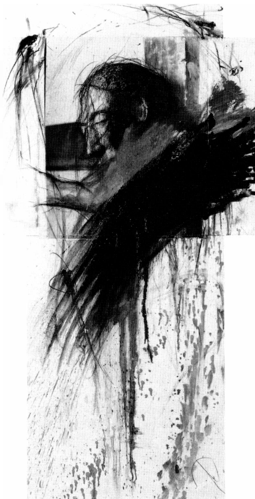
Abb. 1: Fingermalerei – Kreuzübermalung, 1987, Mischtechnik auf Fotokarton auf Wabenkernplatte collagiert, 150 x 80 cm, Galerie m Bochum, © Arnulf Rainer

Farbe läuft auf dem kreuzförmigen Malgrund herab, wilde Fingermalerei beschmiert die Reproduktion eines Kruzifixes, kritzelige Li-