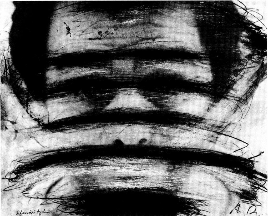
Abb. 3: Face Farce (Schnätzchen) , um 1970, Mischtechnik auf Fotografie, 65 x 50 cm, Privatsammlung, © Arnulf Rainer

Bildoberfläche (vgl. Abb. 3). Der Malduktus ist wild, aggressiv und lässt den Entstehungsprozess durchscheinen. Rainer beschreibt seine Arbeitsweise selbst wie folgt: