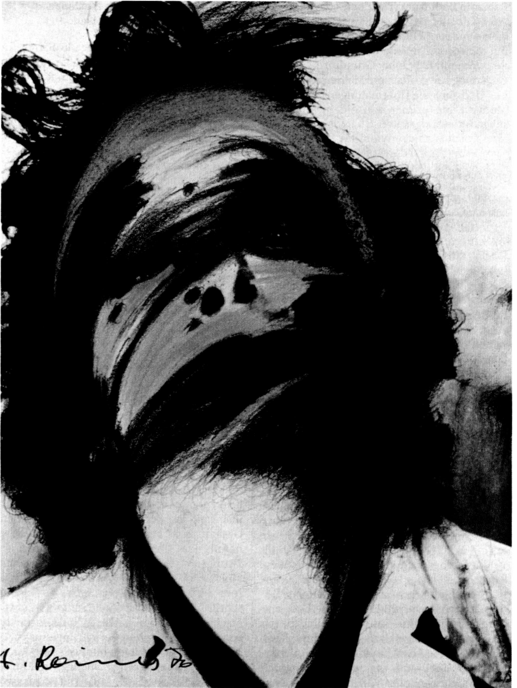
Abb. 2: Face Farce (Clown), 1970, Ölpastellstifte auf Fotografie auf Holz, 95 x 73 cm, Privatsammlung, © Arnulf Rainer