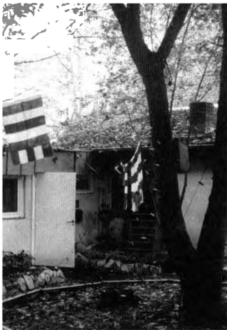
Hof des Bonn Buddhist Temple mit Eingang zur Buddhahalle. An Festtagen wird der Hof mit buddhistischen Fahnen geschmückt.