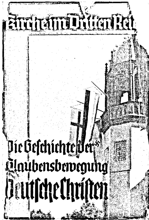
Abb. 2: Arnold Dannenmann: Geschichte der Glaubensbewegung Deutsche Christen

sionskunde zu lebensmächtiger Gestaltungskraft in unserem Volke gekommen.« 25