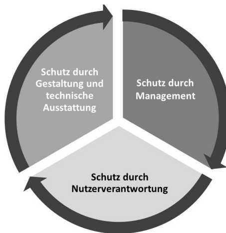
Abbildung 3: Schutzdimensionen der Auditprüfung des „Niedersächsischen Qualitätssiegels für sicheres Wohnen“

Anhand einer Checkliste (mit Leitfragen) wird veranschaulicht, worauf es bei der Bewertung eines Siedlungsbestands nach diesen Kriterien ankommt. Interessierte am Qualitätssiegel können anhand der Checkliste selbst überprüfen, ob ihr Wohn-