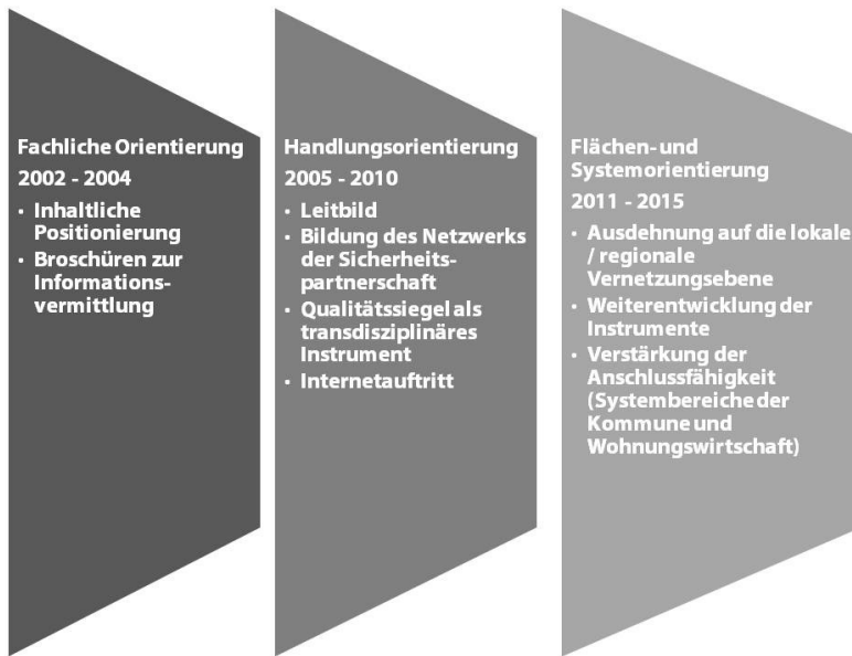
Abbildung 4: Entwicklungsstufen zur Etablierung der städtebaulichen Kriminalprävention in Niedersachsen