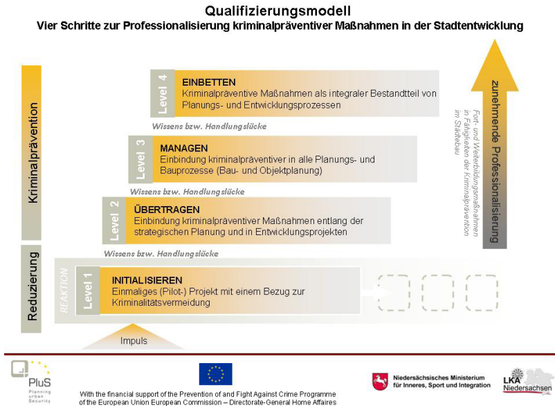
Abb. 2 Qualifizierungsmodell zur Professionalisierung der Kriminalprävention in der Stadtentwicklung

Auf Level 1 setzt die Sensibilisierung ein. Ein (Pilot-)Projekt mit dem Bezug zu bestehenden Unsicherheiten oder zur Kriminalität wird initiiert, bestehende Unruhen, deviantes Verhalten oder Delikte durch bestimmte Maßnahmen sollen verringert werden. Impulse können aus unterschiedlichen Bereichen kommen, z.B. durch Wohnungsmarktanalysen, Bevölkerungsbefragungen oder kriminologischen Regionalanalysen. Experten und Expertinnen können nicht nur auf bestehende Konflikte aufmerksam machen sondern sollen in die Lage versetzt werden, geeignete Vermeidungsstrategien zu entwickeln.