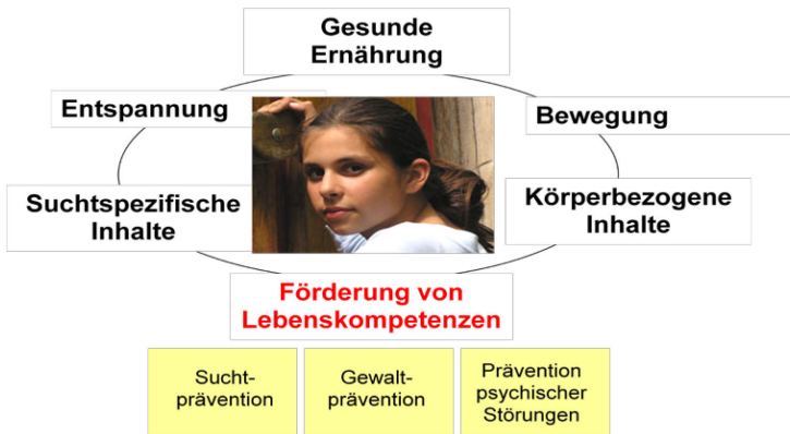
Abb. 3: Inhalte und Komponenten des Programms Klasse2000.

Die Finanzierung erfolgt durch private Spenden in Form von Patenschaften für einzelne Schulklassen (220 € pro Klasse und Jahr).