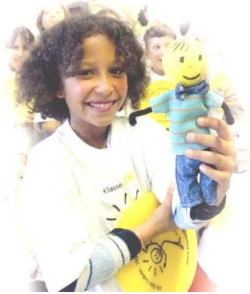
Abb. 2: Die Identifikationsfigur „KLARO“.

Inhaltlicher Kern des Programms ist die Förderung von Lebenskompetenzen. Darunter werden soziale und persönliche Kompetenzen wie Empathie, Konfliktlösefähigkeit, erfolgreich kommunizieren, sich entspannen und Stress bewältigen gefasst, ebenso wie Problemlösefähigkeiten und Selbstregulation, beispielsweise der Umgang mit „Gefühlsstürmen“.