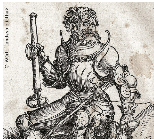
Abbildung Josuas mit den Gesichtszügen Luthers (Ausschnitt).

Intensiver als das Septembertestament wurde die Ausgabe von 1534 mit Holzschnitt-Illustrationen, meist aus der Werkstatt des Monogrammisten M. S., ausgestattet. Die Bilder sollten die Aussage des Textes unterstützen und nicht nur den Verstand, sondern auch die Sinne ansprechen. Im Einverständnis mit Luther wollten die Drucker auf diese Möglichkeit, die biblische Botschaft den Lesern eindrücklich zu vermitteln, nicht mehr verzichten. Nachdem die ganze Bibel in Luthers Übersetzung vorlag, konnte sie zur Grundlage volkssprachlicher Bibeln in anderen Ländern werden, die von der Reformation erfasst wurden. Das gilt insbesondere für frühe niederländische und schwedische Bibelausgaben.