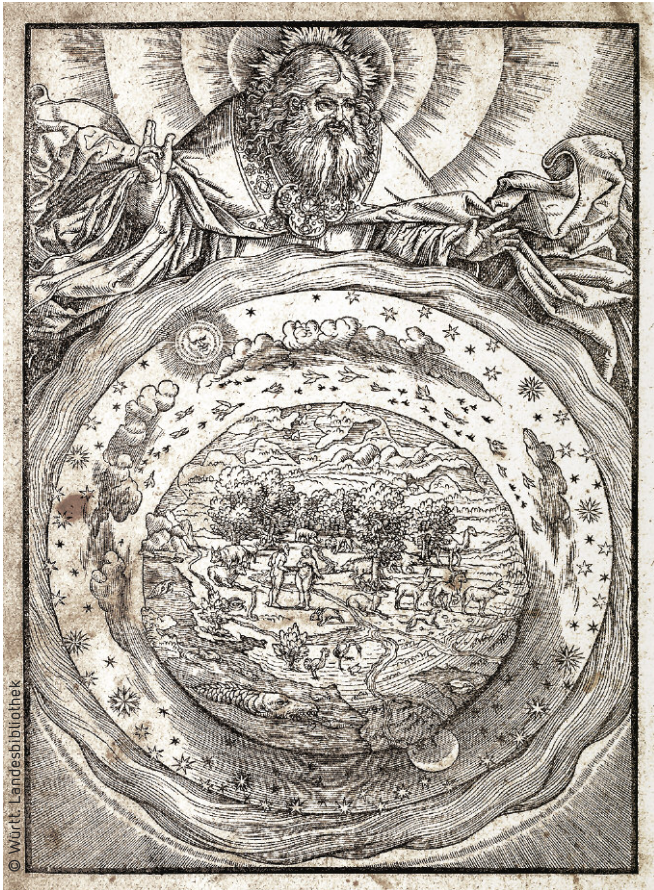
Schöpfungsbild aus der Werkstatt des Monogrammisten M. S.

Wirkung seines Wortes zu trennen ist: »sehen / wie gar sicher vnd stolziglich / die Gottlosen Gottes wort verachten / vnd so gar nicht vmb sein dreyen geben / als were Gott selber ein lauter Nichts«.