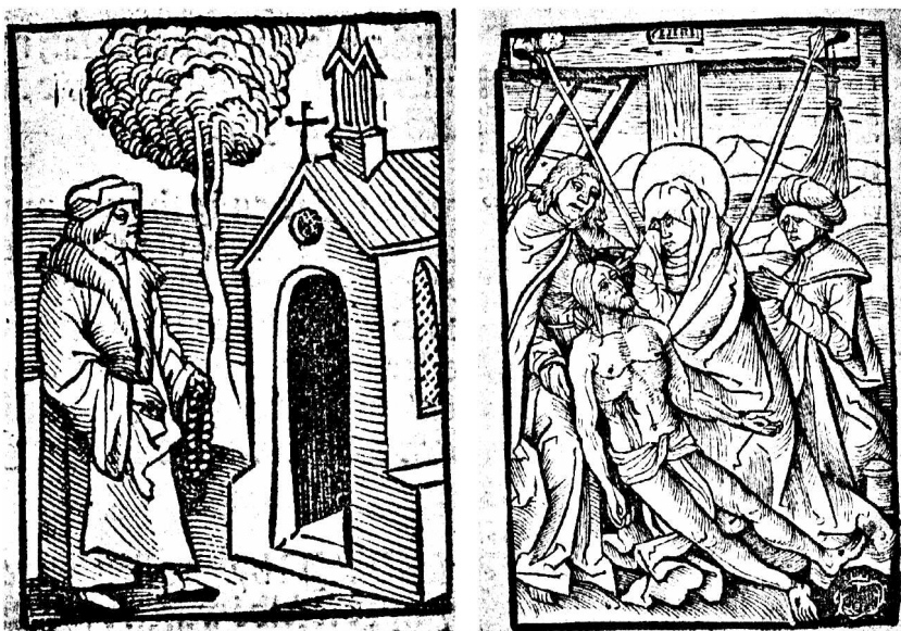
Abb. 1-2: Sermon von dem Ablass und Gnade, Titel- und Schlussblatt

Luther selbst sah sich an das Wort Gottes gebunden, wollte durch sein auf das Wort Gottes bezogenes sprachliches Argument überzeugen. Jedoch erkannte er die didaktische Wirkung begleitender Bilder an. Insbesondere in den Nachdrucken der Wittenberger Originalausgaben seiner Schriften erwies sich die Beigabe bildlicher Darstellungen als verkaufsförderliche Zusatzausstattung. Durch Bilder konnten Teilaspekte komplexer Sachverhalte betont oder unmittelbar aufeinander bezogen werden.