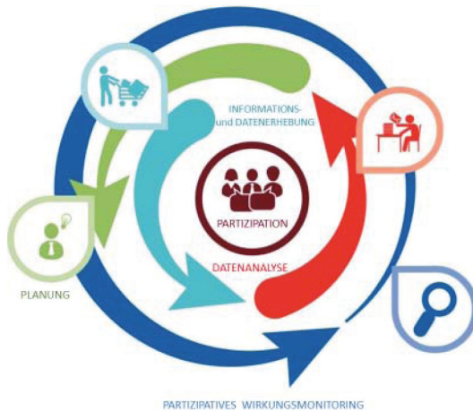
Grafik zur Veranschaulichung der unterschiedlichen Schritte der partizipativen Planung