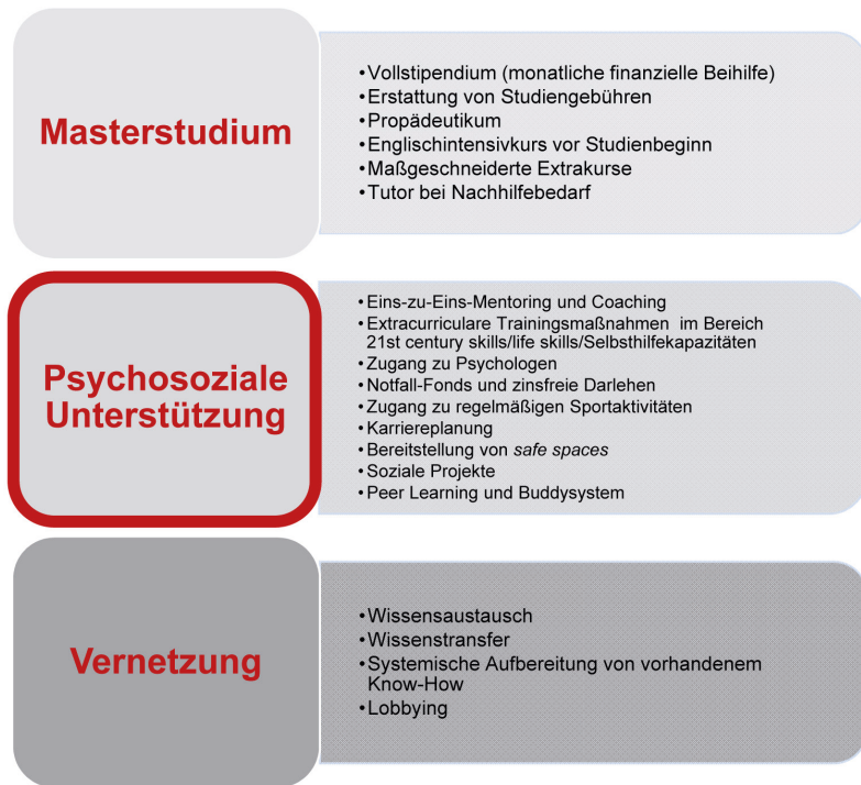
Illustration: Komponenten des integrierten Betreuungsangebots für die Stipendiaten