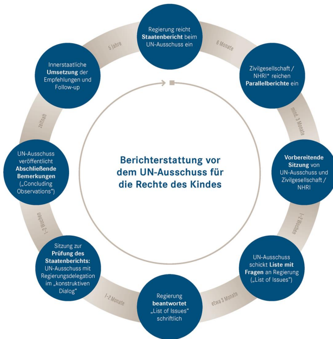
Abbildung 2: Die acht Phasen des Staatenberichtsverfahrens der UN-Kinderrechtskonvention (Deutsches Institut für Menschenrechte 2017, S. 3)

Das Deutsche Institut für Menschenrechte ist 2015 von der Bundesregierung beauftragt worden, die Umsetzung der UN-KRK in Deutschland zu begleiten und hat dafür die unabhängige Monitoring-Stelle UN-KRK eingerichtet. Die Monitoringstelle präsentiert den Vereinten Nationen Parallelberichte zu den Staatenberichten der Bundesregierung über die Umsetzung der Kinderrechtskonvention und nimmt damit Einfluss auf die abschließenden Bemerkungen des UN-Ausschusses (BMFSFJ, 2020). In der folgenden Abbildung stellt die Monitoringstelle den Ablauf des Staatenberichtsverfahrens zur UN-Kinderrechtskonvention anschaulich dar: