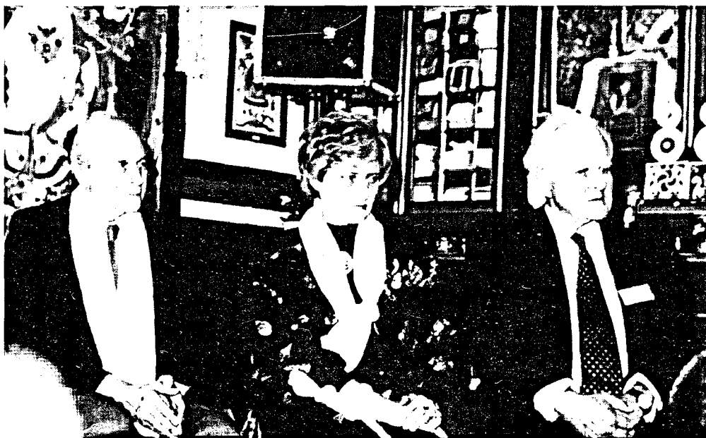
Abb. 3 Carl Friedrich VON WEIZSÄCKER mit den Grünen-Politikern Petra KELLY (1947–1992) und Gert BASTIAN (1923–1992) (von rechts nach links) in einem tibetischen Tempel, undatiert

Die Identität von ātman und brahman ist nicht ein aus spekulativer Deduktion abgeleiteter Begriff, sondern Versuch der Beschreibung einer bestimmten Erfahrung. Erkenntnismittel ( pramāṇa ) ist nicht das Denken ( manas ), sondern Meditation oder anbetende Geisteshaltung ( upāsana ). Es handelt sich um ein Gewahrwerden dessen, was in Wirklichkeit ist. Wer das weiß ( veda ), wird eins mit dem Absoluten in allen seinen Formen, weil ja in Wahrheit nichts anderes als dieses Eine ist. 77 Im Streben nach diesem Wissen, das nicht rationale Erkenntnis, sondern Gnosis ( jñāna ) ist, begegnet uns der Grundzug indischer Religiosität.