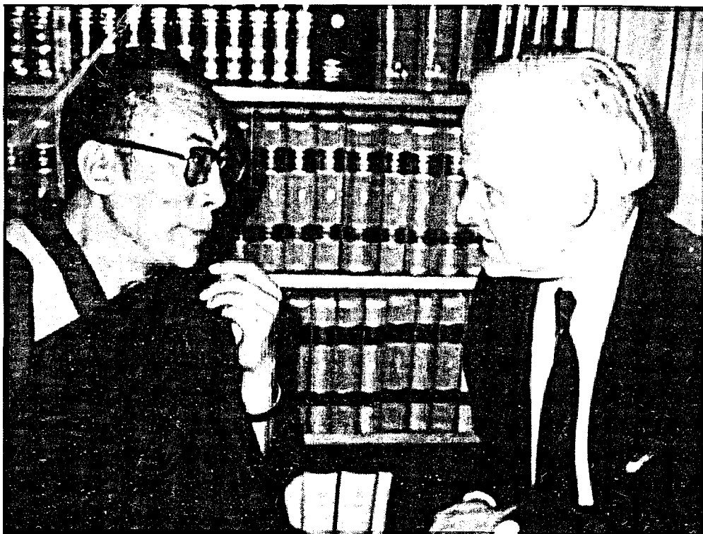
Abb. 1 Carl Friedrich von WEIZSÄCKER mit dem DALAI LAMA, undatiert

Dazu folgende Bemerkungen: Die Begegnung mit Gopi KRISHNA im Jahre 1968 hat sich zwei Jahre später, 1971, literarisch niedergeschlagen. 10 CFvW hat es gewagt, unter dem Titel Biologische Basis der Glaubens-Erfahrung , die Kundalini-Erfahrung Gopi KRISHNAS zu beschreiben und zu interpretieren, tastend und vorläufig, wie er bemerkt. Er tut dies mit Mitteln der Interpretation naturwissenschaftlicher Daten, die er nicht nur dem aristotelischen Empirismus, sondern auch den neuplatonischen Taxonomien entnimmt. Das ist kühn, vor allem zu einer Zeit, als indische Gurus und Yogis noch mit dem abfällig gemeinten Begriff der Esoterik verbunden wurden, als die Psychosomatik zwar schon von Viktor von WEIZSÄCKER (1886–1957) entwickelt worden war, im weiteren Wissenschaftsdiskurs aber noch eine marginale Rolle spielte. Heute ist das anders. Wir können fragen, wie es zu dieser Veränderung kam. Dieser Wandel im Wissenschaftsdiskurs hängt zusammen mit Thomas KUHNs (1922–1996) Beschreibung der wissenschaftlichen Revolutionen als Paradigmenwechsel, angestoßen natürlich durch die Quantenphysik, die das Weltbild verändert hat. Er ist aber auch hervorgerufen worden durch die cognitive sciences , die sich auf Grund der Neurowissenschaften neu etabliert haben. Sie versetzen KANTS (1724–1804) Erkenntniskritik gleichsam