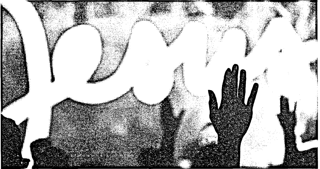
Viele Musikerinnen und Musiker verarbeiten religiöse oder spirituelle Gedanken in ihren Songtexten

ist – einmal ganz klassisch – überzeugter Katholik, während Mel Gibson bekannt ist als katholischer Traditionalist. Ice Cube wiederum zeigt keine Berührungängste vor der antisemitischen Nation of Islam und Tom Cruise wirbt sogar als bekennender Scientologe aktiv für diese höchst umstrittene Organisation.