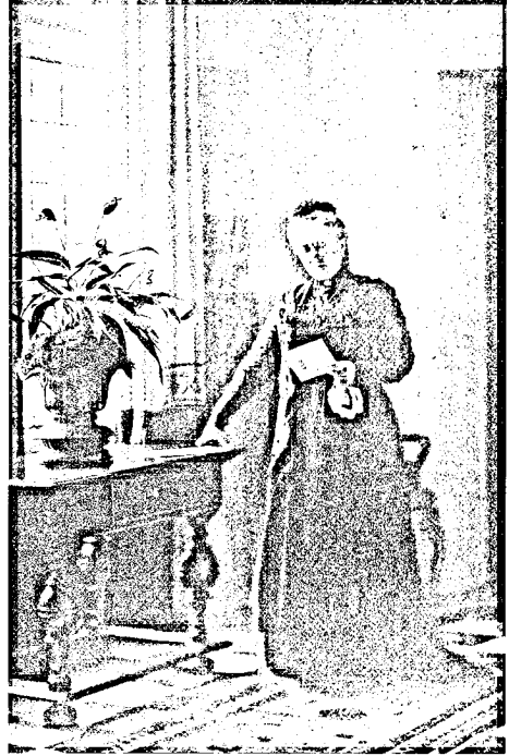
Abb. 3: Gute Beziehungen: Kaiserin Friedrich im Jahr 1900 in Schloss Friedrichshof, Kronberg